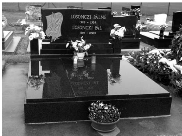
Sírfotó – Losonczy Pál és felesége sírja a barcsi Béke utcai temetőben

Ha Losonczy Pált az egykori pártelit legrejtőzködőbb tagjaként aposztrofáljuk, ez a megállapítás a politikus magánéletére, felesége ismertségére hatványozottan vonatkozik. Bizonyára sokan úgy vélik, ez a téma érdektelen. Az adatok felkutatásával foglalkozni kárba veszett idő. Az államfői és az államfő feleségének adományozott kitüntetésekét őrző múzeumban dolgozó történész-muzeológusnak azonban más a véleménye. A tárgyak verifikációjához 3 a kitüntetett személlyel kapcsolatos információk, ismeretek összessége is hozzátartozik. Losonczy Pál, „az önálló nézetek nélküli kádári találmány” 4 mivoltával együtt a Kádár-kori Magyarország emblematikus figurája volt. Személyiségének megrajzolásával, kapcsolatainak kutatásával minden bizonnyal a kor jellemző viszonyainak megragadására nyílik lehetőség.