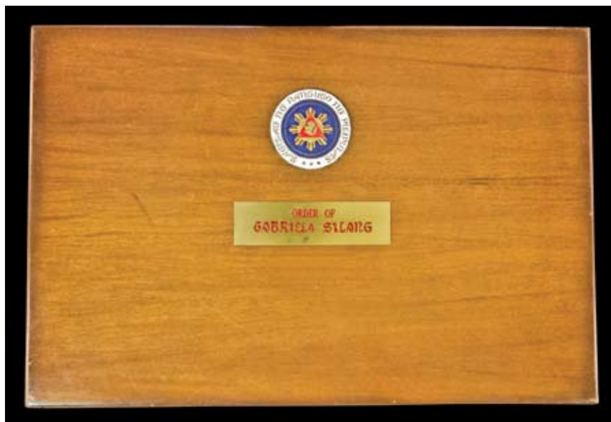
Doboz az elnöki pecséttel