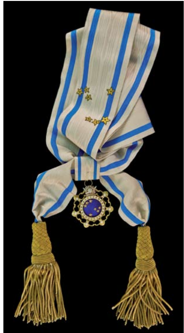
Érem a vállszalagon