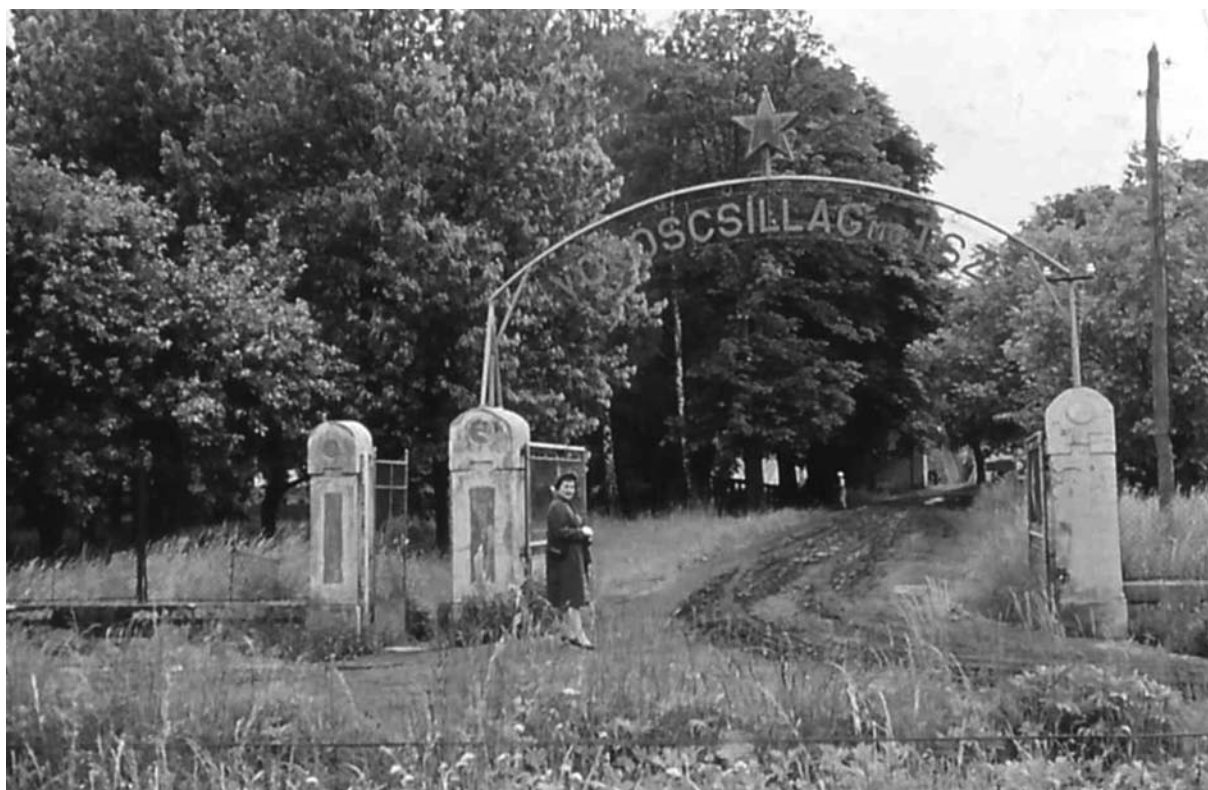
Losonczy Pálné a barcsi Vörös Csillag Termelőszövetkezet gépműhelyének bejáratánál, 1950-es évek