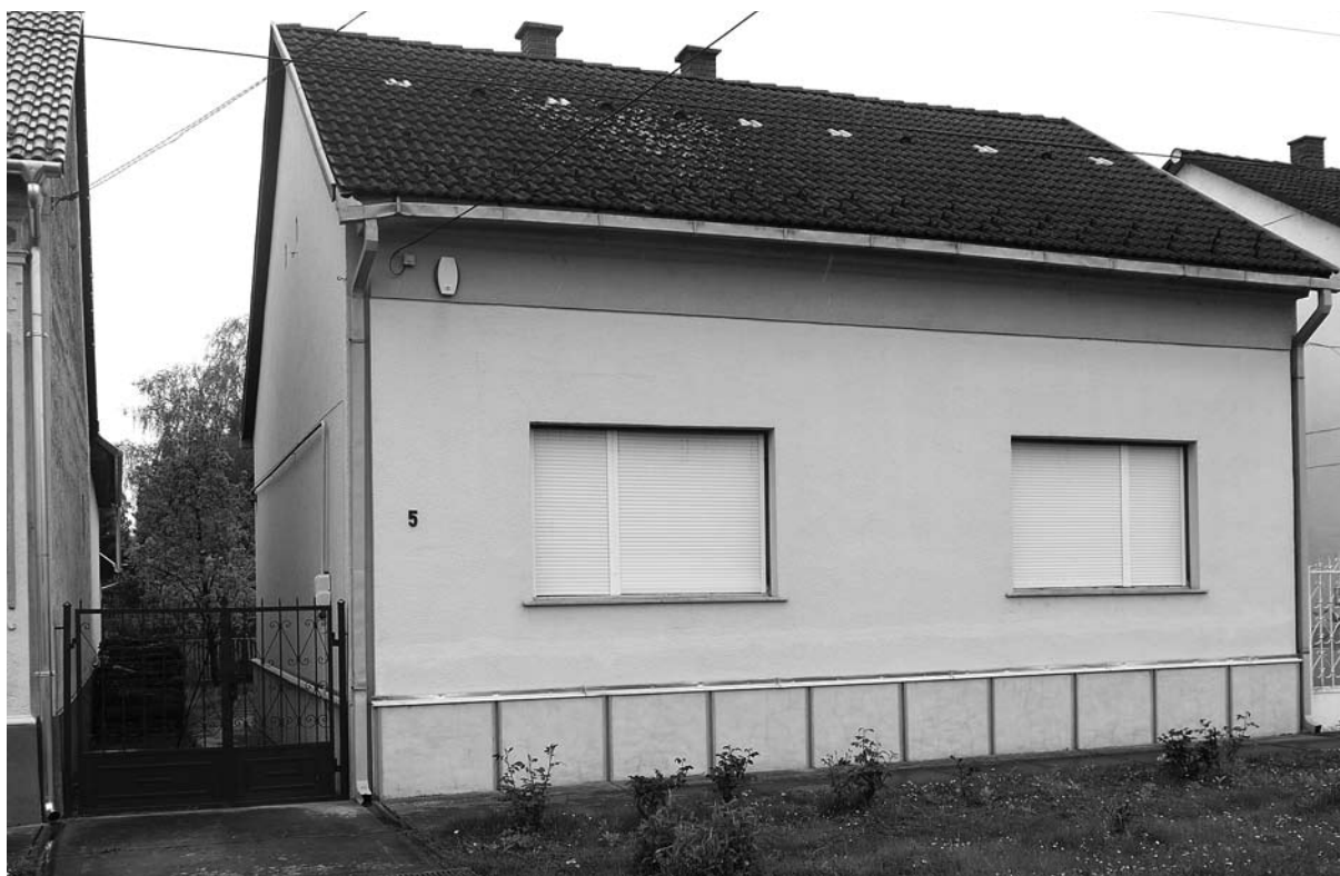
Losonczi Pál egykori lakóháza a barcsi Semmelweis utcában