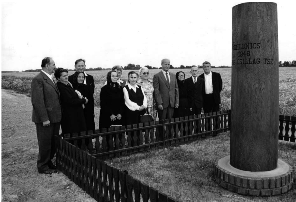
Losonczi Pál és felesége a barcsi Vörös Csillag Termelőszövetkezet alapítóinak 35. éves találkozásán Szilonicpusztán, 1983.

férje karrierjének alakulása is úgy kívánta, hogy a családnak szentelje magát. Losoncziéknak két fiúk született, Pál és Béla. Egyikük sem él már. Az ifjabb Pálnak egy fia, Bélának egy fia és egy lánya van. A Losonczi-gyerekek egyáltalán nem kerültek reflektorfénybe, s a rendszerváltással, amikor apjuk korábbi szerepvállalása negatív megítélést nyert, ezt valószínűleg nem is bánták. Az elnök halálát követően a múzeumok érdeklődésétől, megkeresésétől is elzárkózott a család.