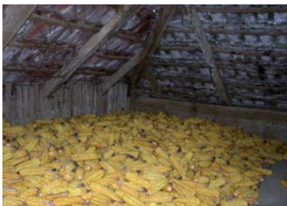
10. ábra: Kukoricátárolás garmadában (Kisgyalán, Kossuth utca) Figure 10: Corn storing in garmada (Kisgyalán, Kossuth Street)