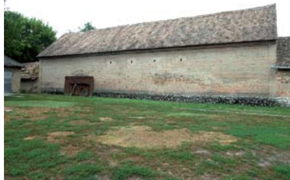
12. - 13. ábra: Hátsó pajta kijárat (Fonó, Petőfi utca) Figure 12-13: Back exit of a shed (Fonó, Petőfi Street)