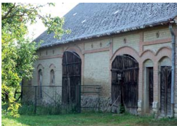
8. ábra: Az istálló az épületegyüttes végén található (Fonó, Petőfi utca) Figure 8: Stable at the end of the block (Fonó, Petőfi Street)