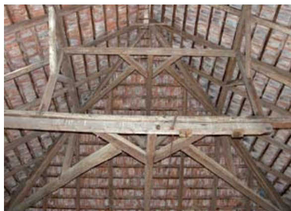
11. ábra: Ollólábás tetőszerkezet (Fonó, Petőfi utca) Figure 11: „Ollólábás” roof (Fonó, Petőfi Street)