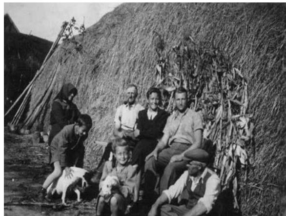
7. ábra: Kazal Kisgyalán Figure 7: Stack Kisgyalán