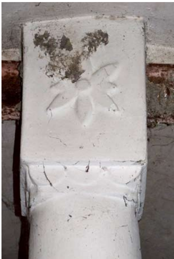
1. ábra: Tartó oszlop (Fonó, Petőfi utca) Figure 1: Supporting-pillar (Fonó, Petőfi Street)