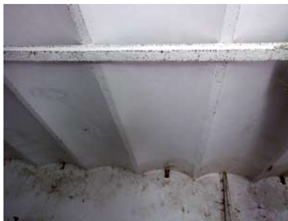
2. ábra: Mennyezetgerenda vasból (Fonó, Petőfi utca) Figure 2: Iron rafter (Fonó, Petőfi Street)