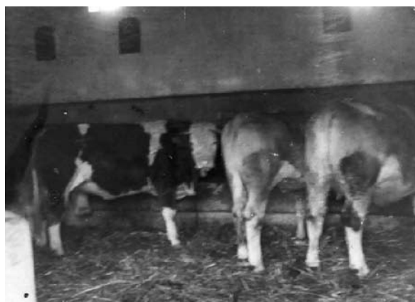
3. ábra: Tágas, szellős istálló, hosszú állásokkal Figure 3: Spacious shed with long stalls