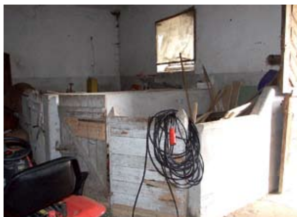
5. ábra: Borjú zárt kötetlen tartása (Fonó, Petőfi utca) Figure 5: Calf kept in a stall (Fonó Petőfi Street)