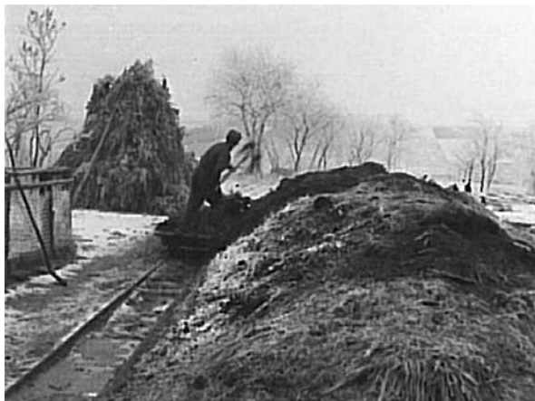
6. ábra: Pánvádlés kocsi a trágya kitolásához (Fonó, Petőfi utca) Figure 6: Cart for pushing dung aut (Fonó, Petőfi Street)