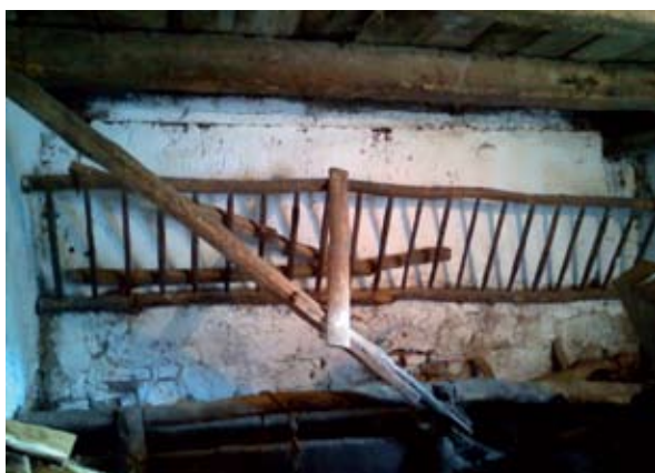
4. ábra: Etetőrács ló és marhák közti választórúddal (Kisgyalán, Kossuth utca) Figure 4: Feeding place separated by a bar for horses and cattles (Kisgyalán, Kossuth Street)