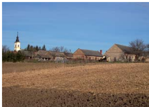
9. ábra: Fonó látképe Figure 9: View of Fonó