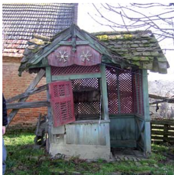
15. ábra: Gazdagon faragott kút (Kisgyalán, Árpád utca) Figure 15: Ornamental well (Kisgyalán, Árpád Street)

„Muskátlí díszlett az ablakban, vagy a virágos padon. A ház előtt két cölöpre deszkát szegeztek, erre tették a virágot, hogy a baromfi ne bántsa.” 19 Hasonlóképp hangulatosabbá teszi Kisgyalánban az egyik udvarban található gazdagon díszített kút is az udvarképet (15. ábra).