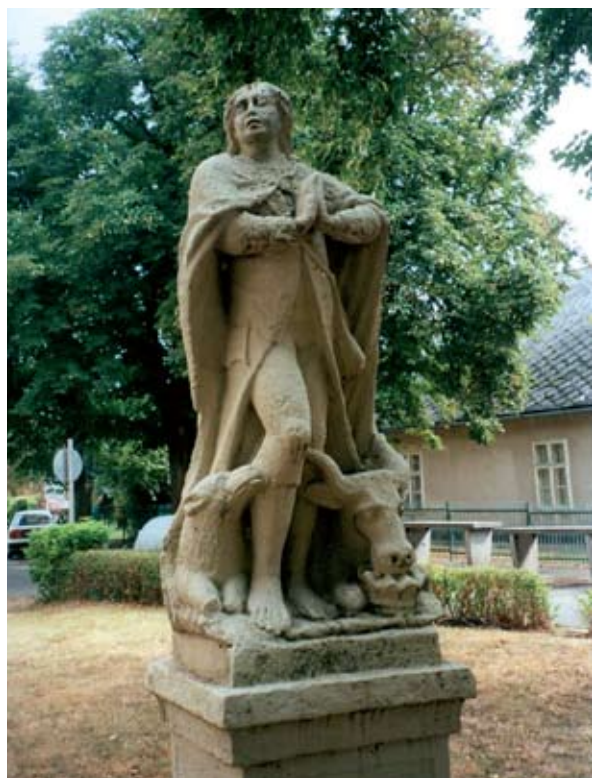
5. ábra: Szent Vendel szobra. Igal, Somogy m. 2013