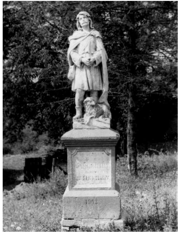
13. ábra: Szent Vendel szobra. Lad, Somogy m. 1978. Lelt.sz.: 22.714