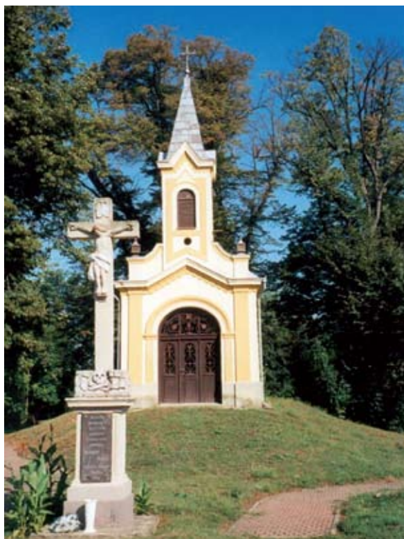
10. ábra: Vendel-kápolna (1928) feszülettel (1750). Gölle, Somogy m. Lukács László felvétele, 2013