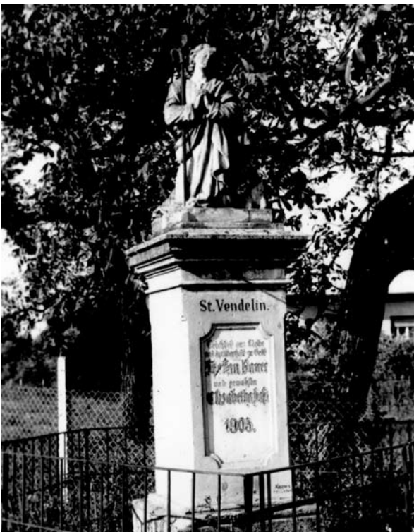
14. ábra: Szent Vendel szobra. Szulok, Somogy m. 1978. Lelt. sz.: 22.780