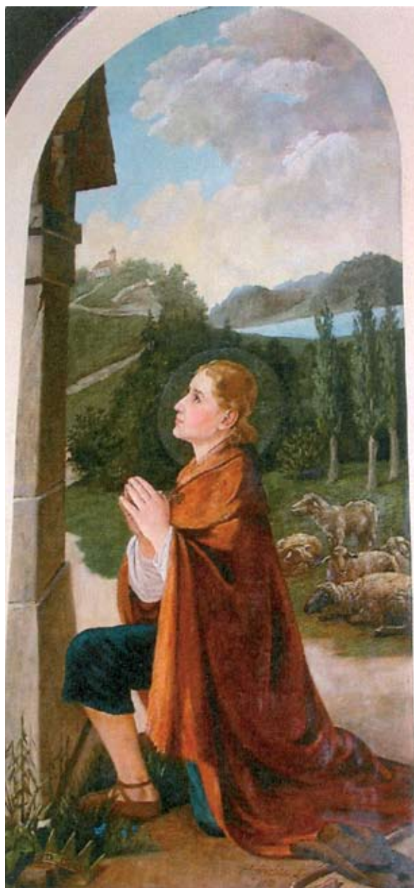
9. ábra: Szent Vendel főoltárkép a pusztaszemesi templomban.