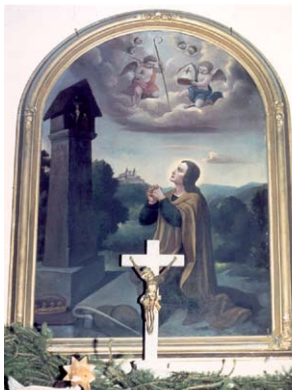
2. ábra: Oltárkép a mernyei Szent Vendel- kápolnában. Lukács László felvétele, 1989