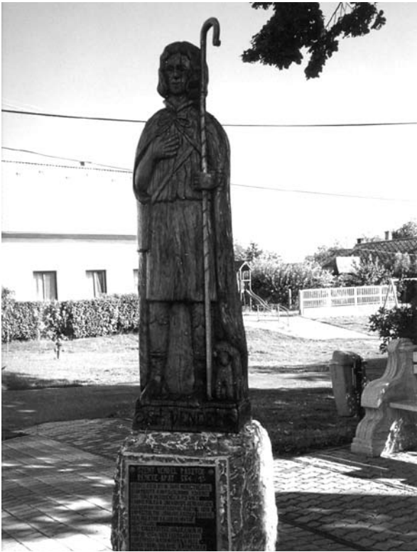
12. ábra: Szent Vendel faszobra Göllében, állították 2011-ben. Lukács László felvétele, 2013