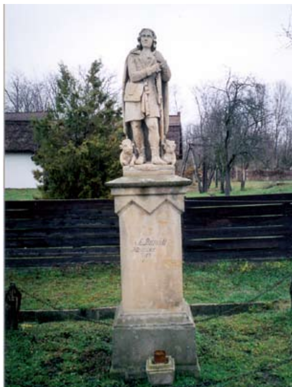
6. ábra: Szent Vendel szobra. Buzsák, Somogy m. Lukács László felvétele, 2004