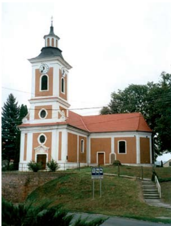
1. ábra: Sárkány Boldogasszony temploma a hozzá- épített Szent Vendel-kápolnával. Mernye, Somogy m. 2013