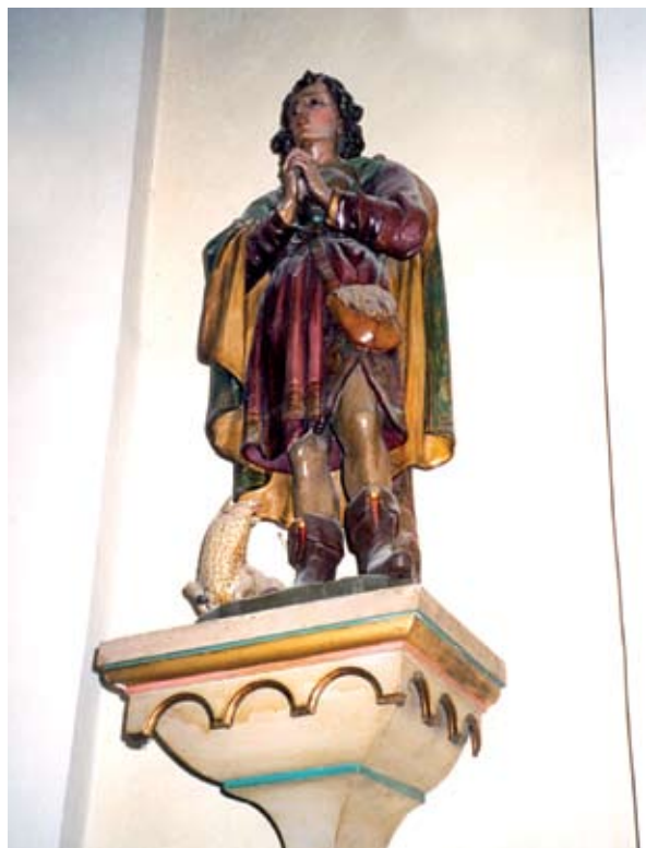
7. ábra: Szent Vendel szobra a törökkoppányi templomban. Lukács László felvétele, 2013