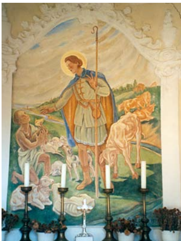
11. ábra: A Szent Vendel kápolna oltárképe Göllében. Lukács László felvétele, 2013