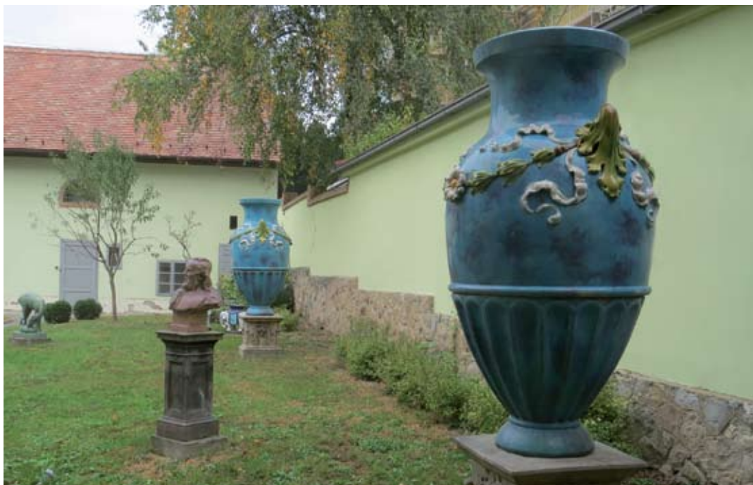
7. és 8. ábra: Egyes szakírók szerint Zsolnay Ignác által Lukafán készített, a pécsi Zsolnay Múzeum belső udvarában ma is látható, kék színű kerti vázák (kratér).