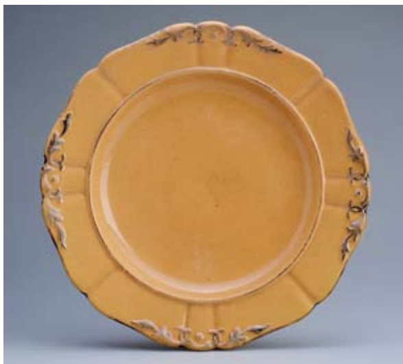
3. ábra: Tányér. Fajansz. (?) Lapos fenekű, pereme ívelt. Színe drapp, a fenék szélén ezüst csík, a perem szélén ezüst rocaille és levél díszítés. Keresztes Tiborné hagyatéka. Származás: Lukafa. (Átmérő 21,5 cm, magasság 3,2 cm. Lelt.sz: IM. 70.147.1.) (Fotó: Áment Gellért, 2013.)

Következő tárgy ugyancsak az Iparművészi Múzeum anyagából való, szerényebb kivitelezésű fajansz tányér, amely feltehetőleg egy étkezési szerviz része (3. ábra).