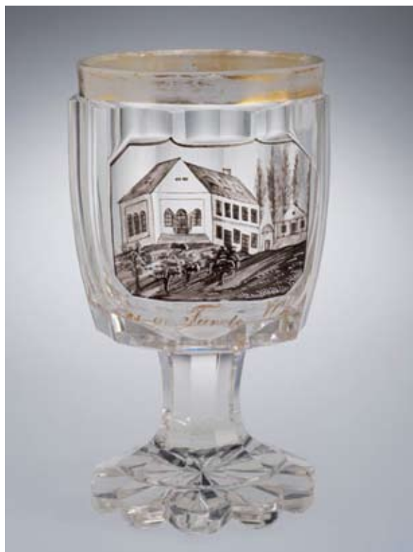
6. ábra: Fördőpohár. Színtelen üveg, tagolt talpa 10 karéjos,... oldalt 10 lapra hámozott... Elől levágott sarkú fekvő téglalapban fák között álló emeletes épület, alatta felirat arannyal: Kávéház és új Fürdő Harkányba. Lukafa /?/ 1860-1870 k. (Vétel, BÁV 118.- Ft, 1958. Lett.sz: IM. 58.1056.1)

juk a vitatott két kékszínű kratér lukafai eredetét, csak megerősíti, hogy a kis lukafai üzemben magas színvonalú termékek is készültek. (7. és 8. ábra.)