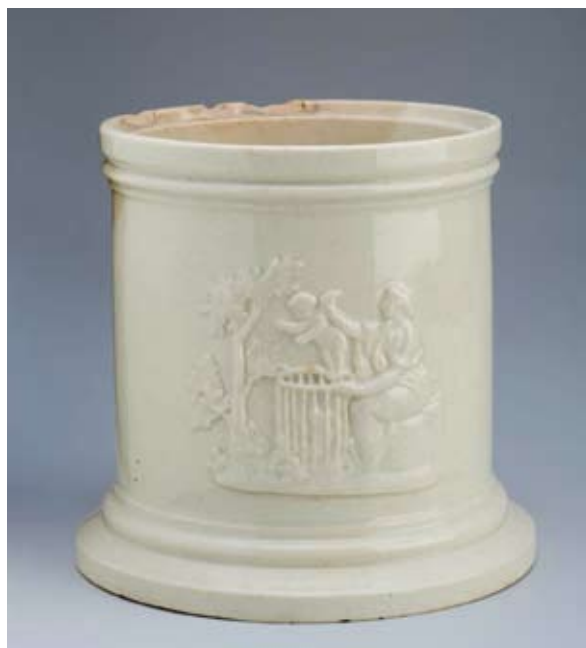
1. és 2. ábra: Dohány tartó. Keménycserép, vajszínű mázzal, oszlop alakú, tagolt-hengeres testén elől, egymásnak megfelelően 2 allegorikus dombormű ábrázolása. Az egyikén Vénusz kosárba teszi a szárnyánál fogva tartott kis Ámort, a másikon egy álló és egy ülő nőalak a kis szárnyas Ámorral. (Fedele hiányzik. Fenekén benyomva: LUKAFA 2. Magassága 13,5 cm, talpszélessége 14 cm. Lelt.sz: IM 19870.) (Fotó: Áment Gellért, 2013.)