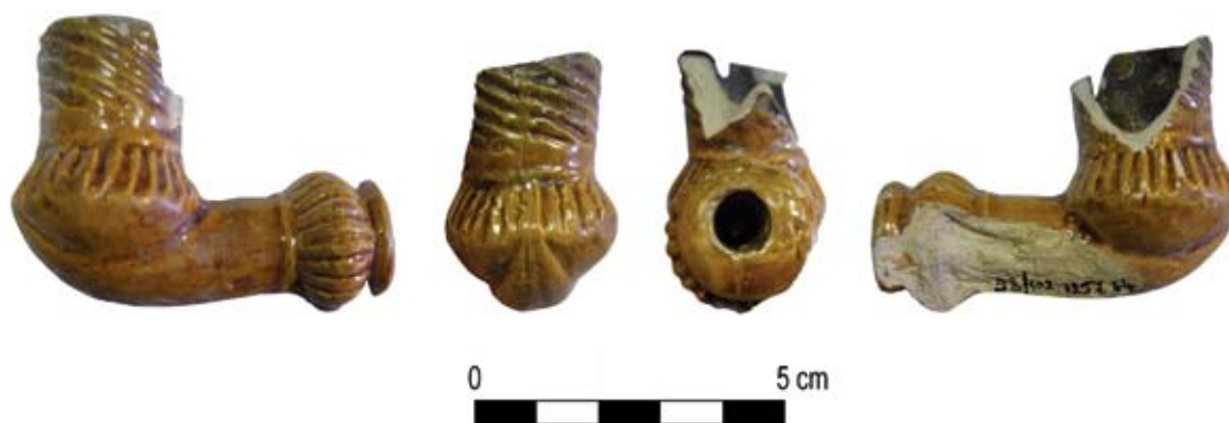
3. ábra: Kora újkori agyagpipa töredéke, 1257. obj., az. sz.: 98/102.1257.64.

kerékített sarkú, téglalap alakú aknasírok voltak, négy sír esetében a fej felőli végénél cölöplyukat találtunk. Érdekes a 486. sír, amelyben az elhunyt gyermek lába alá egy egész téglát helyeztek. 10 Több esetben koporsó nyomait figyeltük meg, valamint több csontváz elhelyezkedése alapján következtetni lehet egykori halotti lepel meglétére. Az elhunytakat háton fekvő, nyújtott testhelyzetben fektették a sírba. A karok a test mellett voltak vagy a medencére hajtották őket.