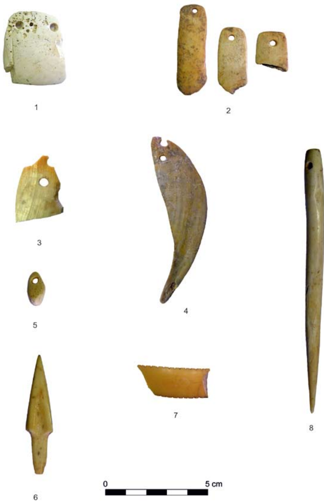
III. tábla: Óskori csont- és kagylótárgyak: 1. 708. obj., az. sz.: 98/1012.708.206., 2. 229. obj., az. sz.: 98/102.229.1-3., 3. 1717. obj., az. sz.: 98/102.1717.55., 4. 758. obj., az. sz.: 98/102.758.3., 5. 714. obj., az. sz.: 98/102.714.26., 6. 1731. obj., az. sz.: 98/102.1731.26., 7. 802. obj., az. sz.: 98/102.802.169., 8. 1081. obj., az. sz.: 98/102.1081.102.