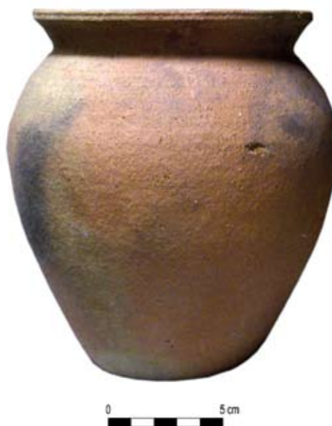
2. ábra: Középkori fazék az ásatásról, 433. obj., az. sz.: 98/102.433.1.

A temetőben 197 sír került feltárrásra, amelyekben 195 csontváz volt. Kettős temetkezés egy esetben fordult elő: az 518/a-b. sírokban feltehetően egy férfi és egy nő feküdt, a kezük össze volt kulcsolva. Három sírban (1642., 1651. és 3252. sírok) nem volt csontváz, ezek előre megásott sírgödörök lehetettek, amikbe nem temettek senkit, esetleg jelképes temetkezések. A sírok kb. negyede volt gyermeksírok. A sírok sírsorokba rendeződnek, azonban néhány sír – főleg a temető