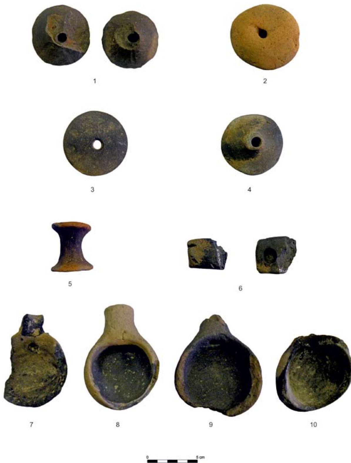
II. tábla: Óskori orsógombok, spulni, mécses (?), agyagkanalak: 1. 2263. obj., az. sz.: 98/102.2263.44-45., 2. 987. obj., az. sz.: 98/102.987.82., 3. 1790. obj., az. sz.: 98/102.1790.18., 4. 1013. obj., az. sz.: nincs, 5. 1882. obj., az. sz.: 98/102.1882.130., 6. 1314. obj., az.sz.: 98/102.1314.500., 7. 1610. obj., az. sz.: 98/102.1610.43., 8. 1826. obj., az. sz.: 98/102.1826.112., 9. 1405. obj., az. sz.: 98/102.1405.26., 10. 1368. obj., az. sz.: 98/102.1368.335.