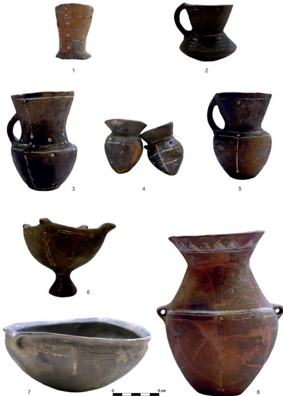
I. tábla: Sírkerámiák az 568. sírból: 1. 34. edény, 2. 106. edény, 3. 37. edény, 4. 60. és 63. edény, 5. 16. edény, 6. 57. edény, 7. 67. edény, 8. 18. edény