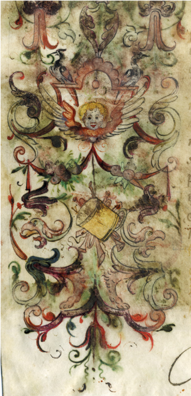
6. kép – Izsó István címerlevelének részlete (magántulajdon)