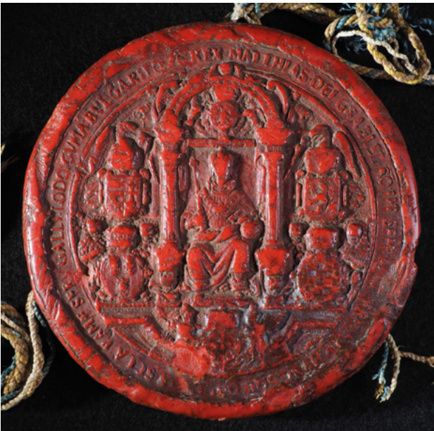
3. kép – Az Izsó-armális kettőspecsétjének előlapja (magántulajdon)