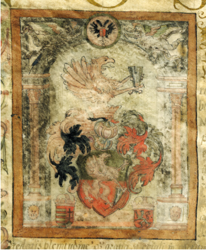
1. kép – Izsó István címereslevelének miniatúrája, 1618 (magántulajdon)