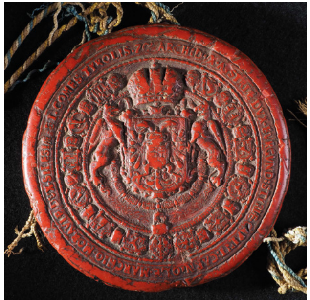
4. kép – Az Izsó-armális kettőspecsétjének hátlapja (magántulajdon)