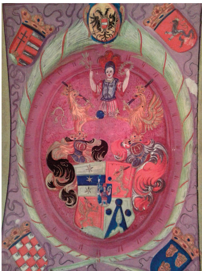
3. kép – A címereslevélén szereplő címerkép

az ő esetében is vagyonságot feltételezett. Mindezek alapján Fritz András az 1690-es években városi polgárként Besztercebánya politikai, gazdasági és kulturális-szellemi elitjéhez tartozott.