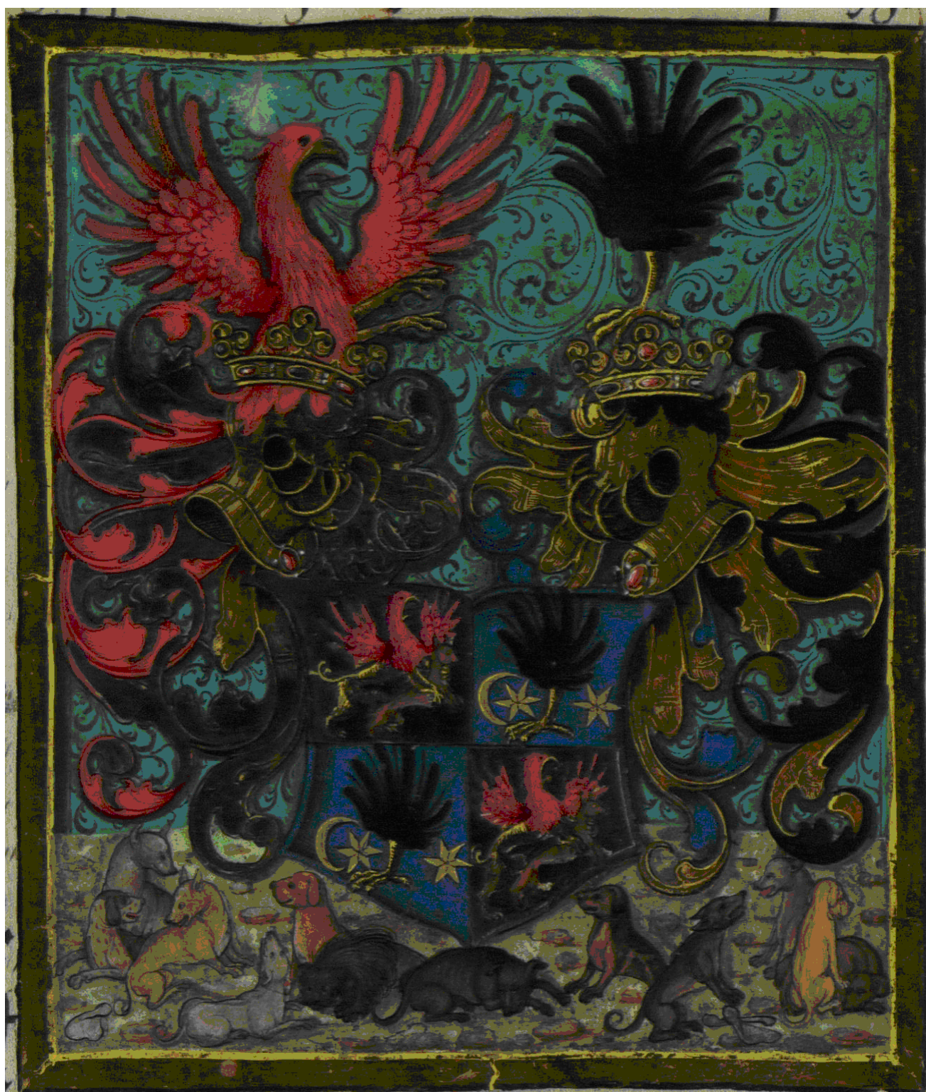
Kanizsai (V.) János 1515-i armálisának címerábrázolása (DL 22713.)