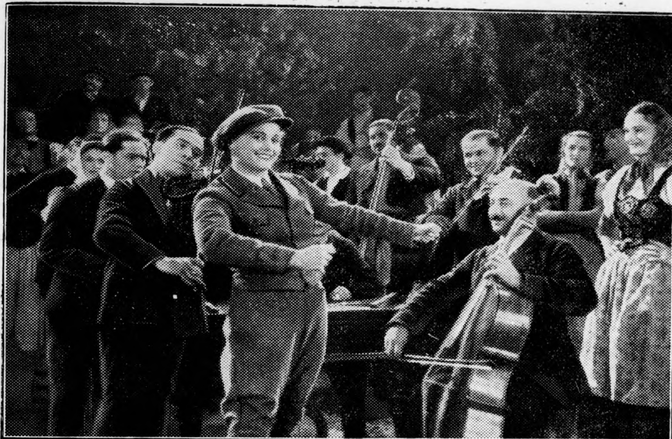
Rökk Marika az Ufa »A telivér leány« című filmjének mulatós jelenetében.