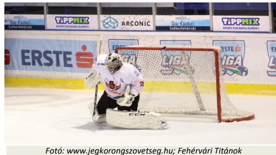
Fotó: www.jegkorongszovetseg.hu; Fehérvári Titánok

Megyei rangadót rendeztek Székesfehérváron. Mind a két csapat a táblázat második felében tanyázik. A hazaiak az utóbbi időben nem igazán gyűjtögettek a pontokat, az Acélbikák viszont zsinórban nyerik a meccseket. A meccs közepén a DAC jutott előnyhöz Silló góljával (32. perc, 0-1). A harmad végén Odnoga is betalált (40. perc, 0-2). A Dunaújváros folytatta remek szereplését. A Titánok ismét vereséget szenvedtek.