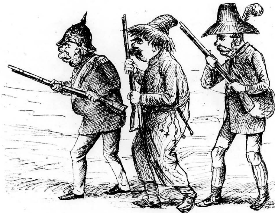
A vadat keresők.