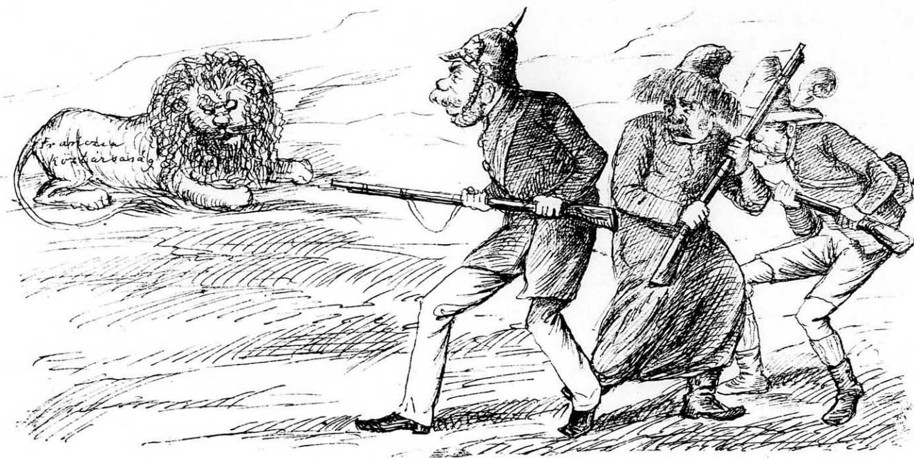
Nyulat kerestek, de oroszlánt találtak.