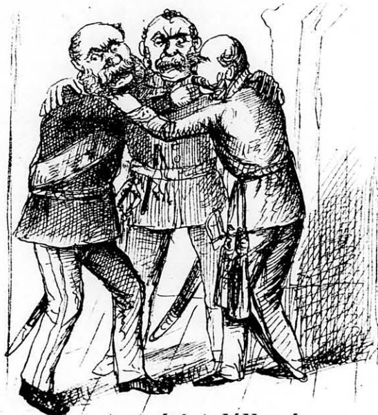
A testvéri találkozás.