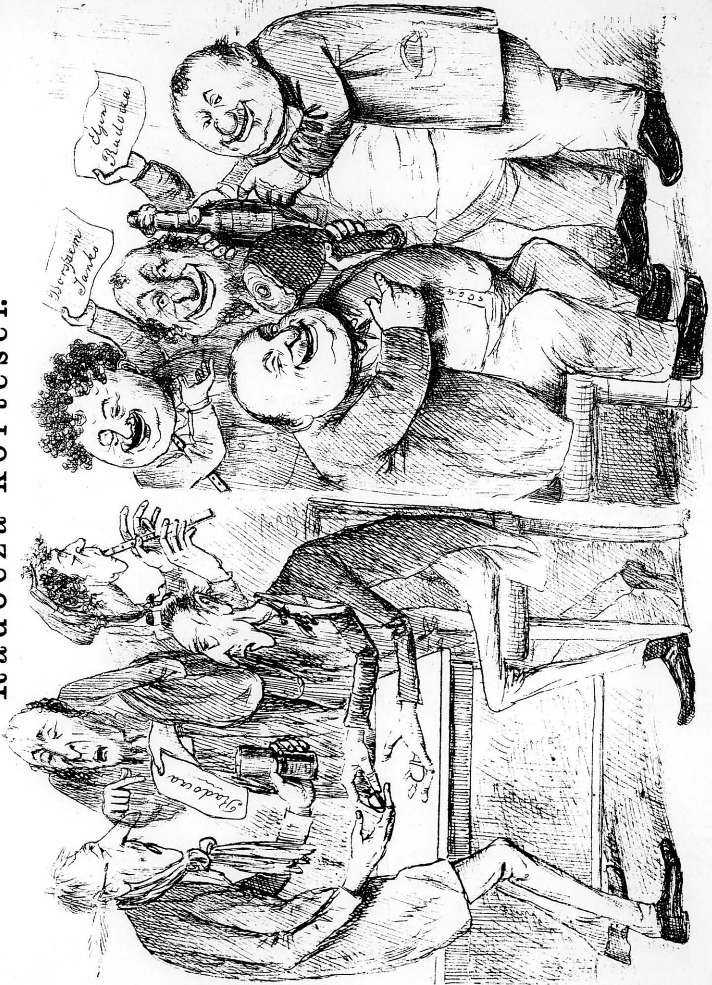
A választás előtt 8 héttel.