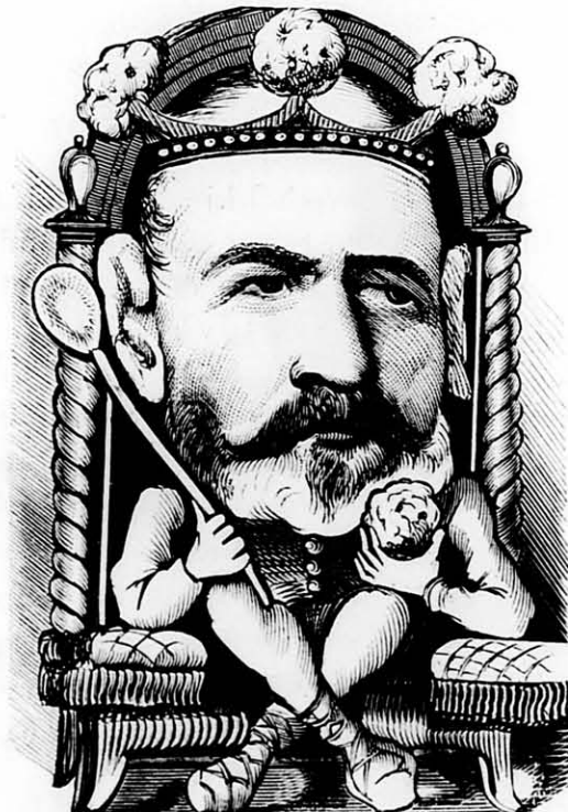
Nr. 31. Ime a „tótkirály“ alias Juszt atyus! Jaki ta csont . . olyan kemény dolegatyus!