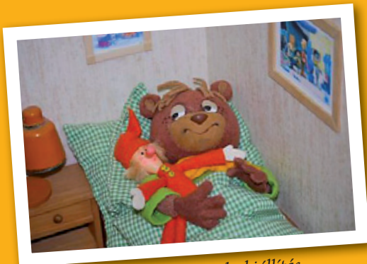
Foky Ottó vándorkiállítás