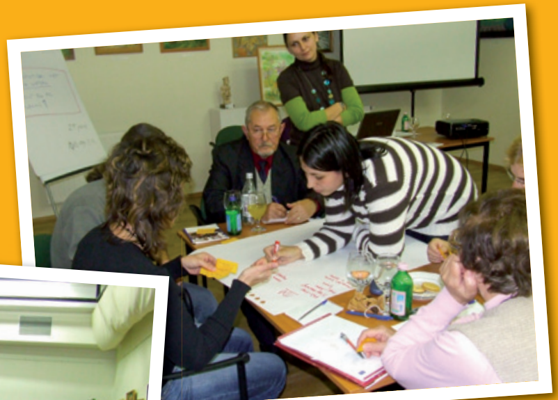
Fókuszban a szervezetfejlesztés konferencia