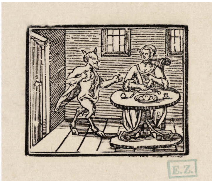
18. századi illusztráció (Galéria umenia Ernesta Zmetáka, GNZ)