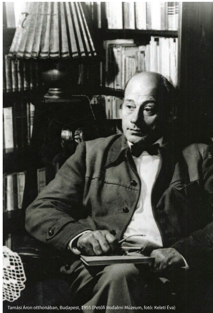
Tamási Áron otthonában, Budapest, 1955