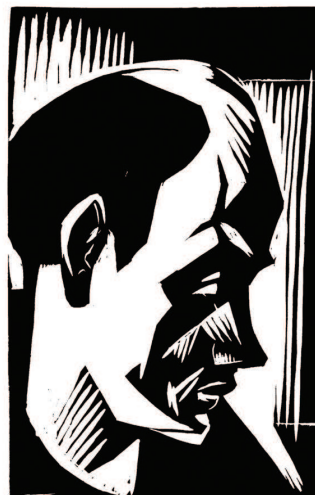
Nagy Imre (Zsögödi): Tamási Áron, fametszet, 1930-as évek, 18 x 24 cm (Csíki Székely Múzeum)

A Hazai tükör Tamási Áron kevésbé ismert, ritkán emlegetett regényei közé tartozik. Pedig a Bölcső és Bagoly című, szintén 1954-ben megjelent önéletírása mellett éppen e művére kapott Kossuth-díjat ugyanebben az évben. Féja Géza, Tamási barátja és első monográfusa az író egyetlen történelmi regényének nevezte, de hozzátette azt is, hogy a szerző „képtelennek bizonyult a történelmi korszak ábrázolására.”