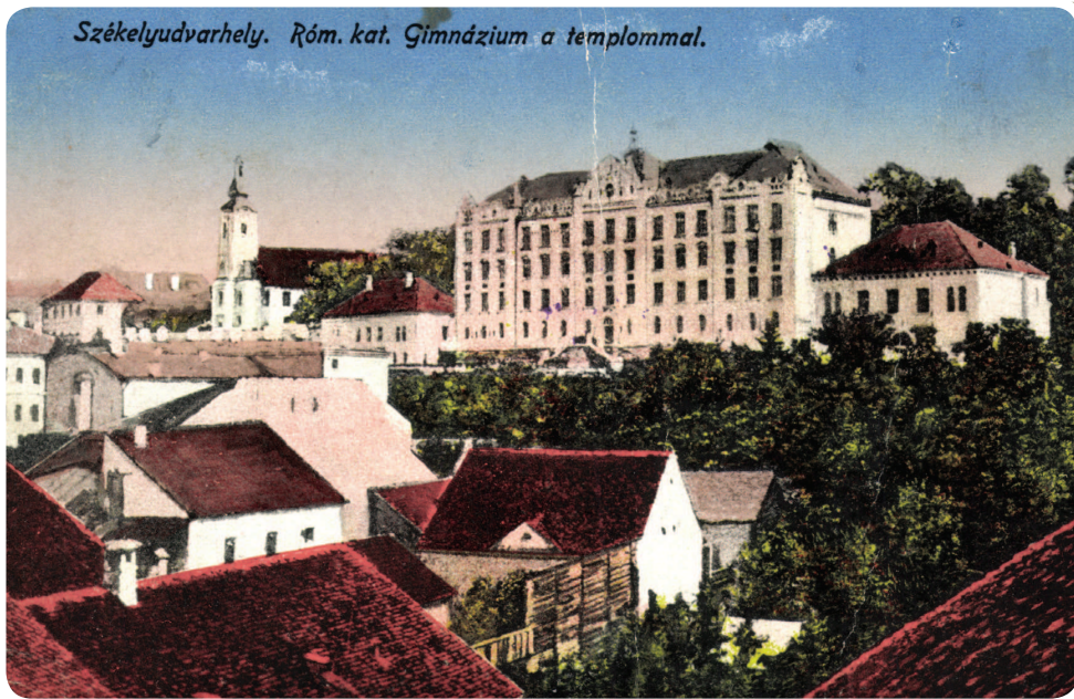
Képeslap Székelyudvarhelyről (Zempléni Múzeum, Szerencs)