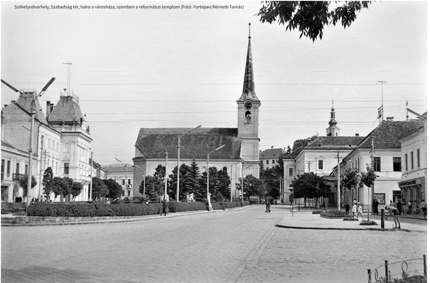
Székelyudvarhely, Szabadság tér, balra a városháza, szemben a református templom

Nemsokára megérkezett Mózsi bácsi, két rossz lóval és egy szánnal, melynek a derekában szénából volt az ülés. Anyám feketébe öltözött, csak a fejkendőjében voltak nagy és eluralkodó ezüstcsíkok, mintha nem is fej, hanem nagy ezüstdíó lett volna a feje. Még egy hárszkendőbe