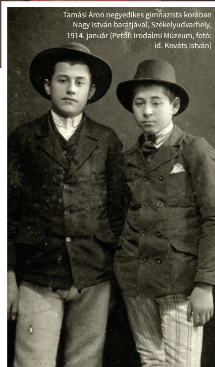
Tamási Áron negyedikes gimnazista korában Nagy István barátjával, Székelyudvarhely, 1914. január

azokkal tartottam, akik valamivel idősebbek voltak nálamnál. Így történt a karácsonyi kántálás dolgában is, ami nagy divatú és szép szokás volt abban az időben, amint azt valahol korábban félszóval említettem is. Egyszer majd elmondom, hogy miképpen kántáltam későbbben én is, amikor már belénőttem a fickólegények sorába; de annyit el kell mondanom most is, hogy a kántáló nyájak szigorú rend szerint alakultak, mely rendnek az életkor és az életkoron belül a választás volt az alapja. Legelől jártak a katonaviselt legények csoportjai, amelyek valódi egycsővű vagy kétcsővű pisztolyokkal járták hajnalig a falut, a legjobb lányokat nagy szertartással és köszöntőkkel meglátogatták, ott ettek-ittak, egy kicsit énekeltek is, majd elvonultokban a pisztolyokkal nagyokat lőttek a leány tisztelőre. Utánuk