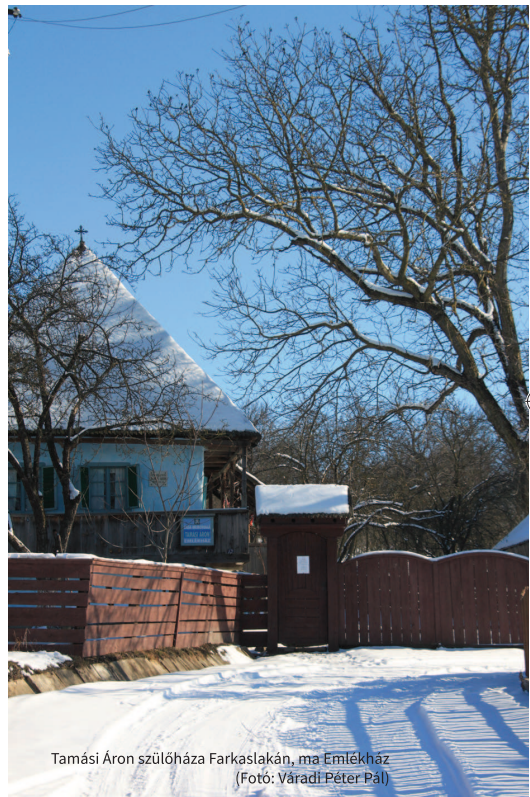
Tamási Áron szülőháza Farkaslakán, ma Emlékház

Felhúztam a jobbik cső kakasát, és a csöpp nyelecskére ráhúztam a kupakot. Ott sárgállott rajta, és a kakas fel volt húzva. Gondoltam, csak meg kéne egy kicsit rántanom alul a ravaszt, s mindjárt óriásit szólna. De azt nem tenném meg semmiért, itt a szobában, esetleg messze künn a kertben. De ha jól megfogom két ujjal a kakast, s a másik kezemmel akkor huzintanom meg a ravaszt: hát igen, akkor nem tudna ráugrani a kupakra, mert én a két ujjammal fogom a