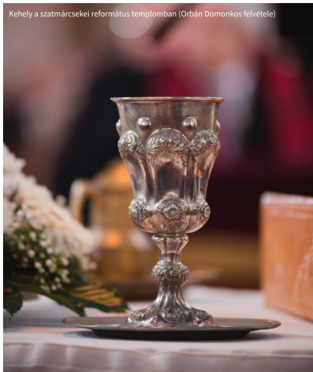
Kehely a satmárcsekei református templomban

De hát mi is az a csoda? A közbeszédnek és egyes sajtótermékeknek gyakorta visszatérő témája, ám a közérdeklődésre feltálat esetekről többnyire ki szokott derülni a család. Egy igaz ember élt ez idáig a földön, aki – indokolt esetben, sohasem saját dicsőségére – valóban képes volt a csodára. Szaporított ételt és italt, járt a tengeren, vakokat, bénákat, leprásokat, megszállottakat gyógyított, oszlásnak indult halottakat hívott vissza az életbe, mert bírta az Atya bizalmát, birtokolta és alkalmazta mindenható erejét. Kétkedők és hitet-