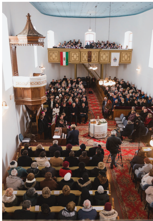
A szatmárcekei református templom

1 Elhangzott 2014. január 19-én a szatmárcekei református templomban, a magyar kultúra ünnepén.