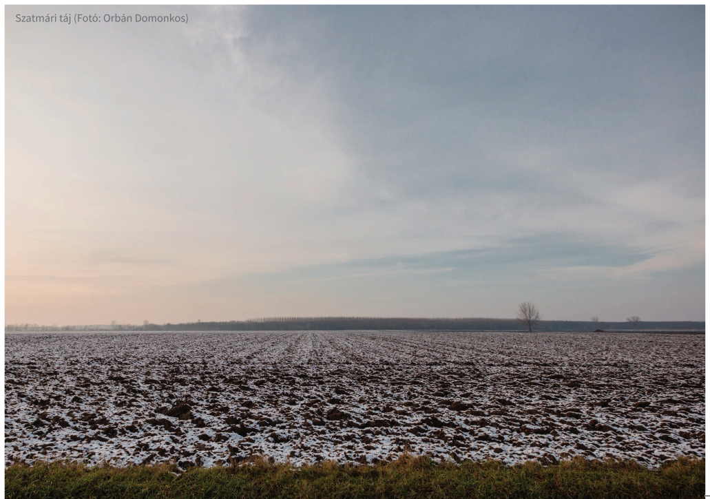
Szatmári táj