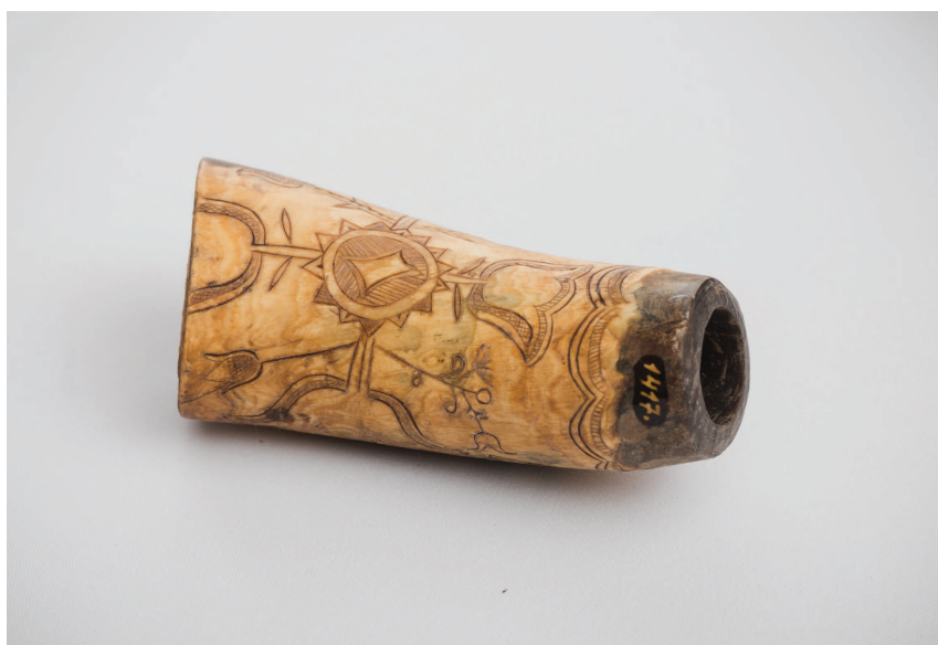
Tárgyi emlék Kölcsey Ferenc korából (Szatmárcseke, Kölcsey Ferenc emlékszóba, fotó: Orbán Domonkos)