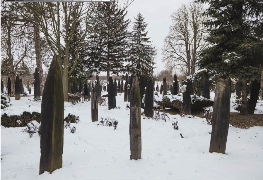
Részlet a csekei református temetőből

gyonára, sem magas társadalmi összeköttetései nem számíthat, aki nem hajlandó kiszolgálni egyetlen szélsőséges politikai csoportosulást sem, csupán saját szilárd jellemére, elkötelezett népszerűtetére, demokratizmusára támaszkodhat, és csakis hivatástudatból áll az igaz ügy szolgálatába. Anélkül, hogy Kölcsey alakját meghamisítaná, Szentimrei Jenő a nagy előd regényes életrajzát önigazolásként írja, a példakép felmutatásának szándékával közeledik a nagy költőhöz, s a szegényes életrajzi elemeket a korrajz árnyalásával, a művekből logikusan következő cselekedetekkel, a riportút során feltárt történetekkel – és természetesen a párhuzamosnak vélhető életrajzi történésekkel – teszi életközelié.