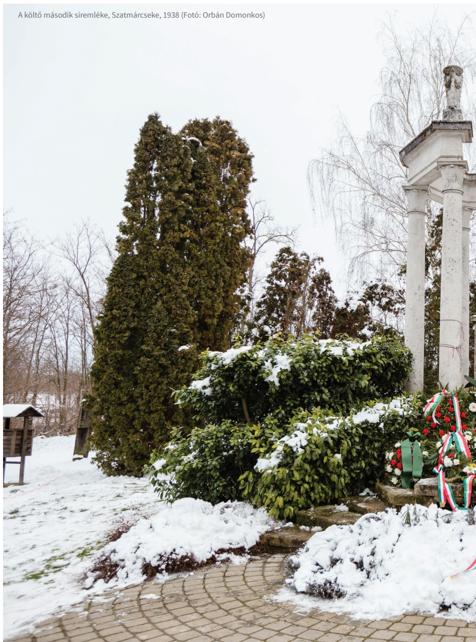
A költő második síremléke, Szatmárcseke, 1938

de azért is, mert nem hitték el, hogy Kölcsey meghalt volna. Van az ilyen szóbeszédéről korábbi feljegyzésünk is. Ormos Zsigmond, az országgyűlési ifjak egyike, aki 1834-ben Pozsonyban többször találkozott a költővel, egy későbbi, 1874-ben megjelent visszaemlékezésében csekei útjának tapasztalatairól számol be. Szerinte a házi cselédek, akiknek a költő szobájába belépniük tilos volt, a kulcslyukon keresztül lesték meg gazdájukat éjjel, s azt látták egy ízben, hogy a költő térdére hajolva ír. Az ilyen tapasztalatok alapján terjedt el először az a hír, hogy Kölcsey aranycsináló. Hiszen számukra az éjszakai írásnak más komoly oka nem lehetett. Tudjuk, hogy ekkor készült Kölcseynek a Wesselényi védelmére írt beszéde, pontosabban a beszéd azon része, melyet maga a költő dolgozott ki. Időben kellett ezt a számára olyan fontos szöveget elkészí-