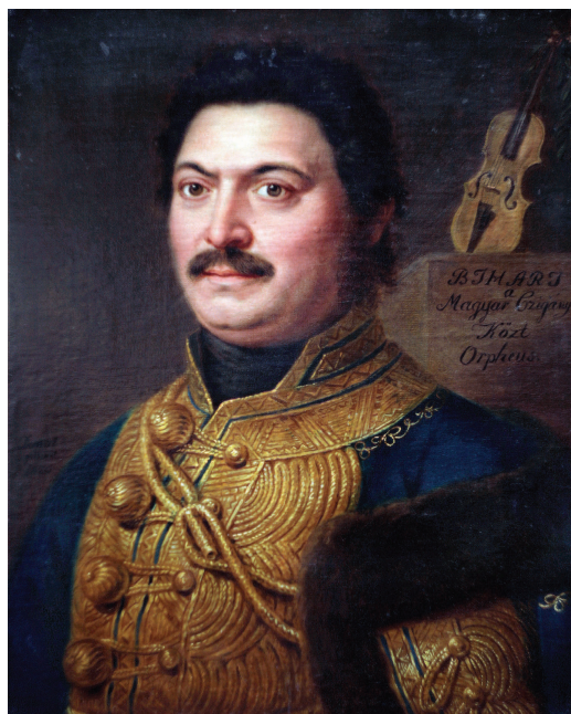
Donát János: Bihari János, prímás, olaj, vászon, 57,8 x 47,5 cm, 1820 (MNM, MTKCs, fotó: Király Attila)

1813-ban végre megjelent költeményeinek első kiadása, majd hama-