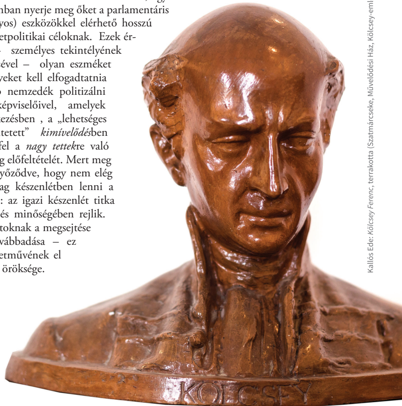
Kallós Ede: Kölcsey Ferenc, terrakotta (Szatmárcseke, Művelődési Ház, Kölcsey-émlékszóba)