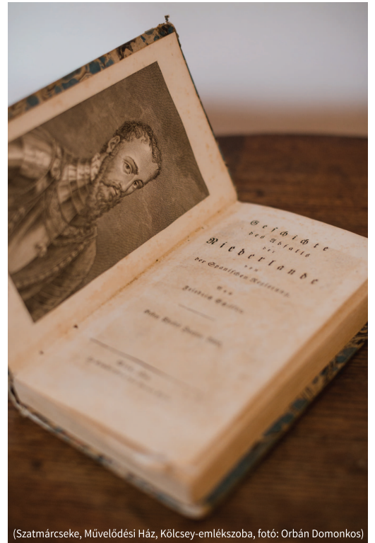
(Szatmárcseke, Művelődési Ház, Kölcsey-emlékszoja)

ízlésével. Goetheért rajong, de verseire Schiller van nagyobb hatással (Szemere Pálhoz, 1813. június 25., Döbrentei Gáborhoz, 1813. november 15.) Állandóan elvagyódik lakhelyéről („Innen Pestre, Pestről Pozsonyba, s onnan Philadelphióba álmodozom...” – Kállay Ferenchez, 1814. december 17.), de ritkán és nehezen szánja el magát, hogy elhagyja otthonát. Van szerelme, s vonzza is az életforma, amit a házasság kínál, mégse nősiül, inkább „álmainak áldozza fel a napokat, melyeken az égnek minden boldogságát fogta volna bírhatni.” (Kazinczyhoz, 1814. május 31.) Szabadságvágya tartja vissza attól, hogy a családi élet szoros kötöttségét vállalja, mégis sokszor azért érzi magát boldogtalannak, mert „nincsenek kötelékei” (Kazinczyhoz, 1813. október 21. és 1814. május 31.). A meglévő kötöttségeket olykor úgy éli meg, mint a legsúlyosabb sorsterhet, ami megakadályozza abban, hogy hajlamai és tehetsége szerint éljen, ám kritikus