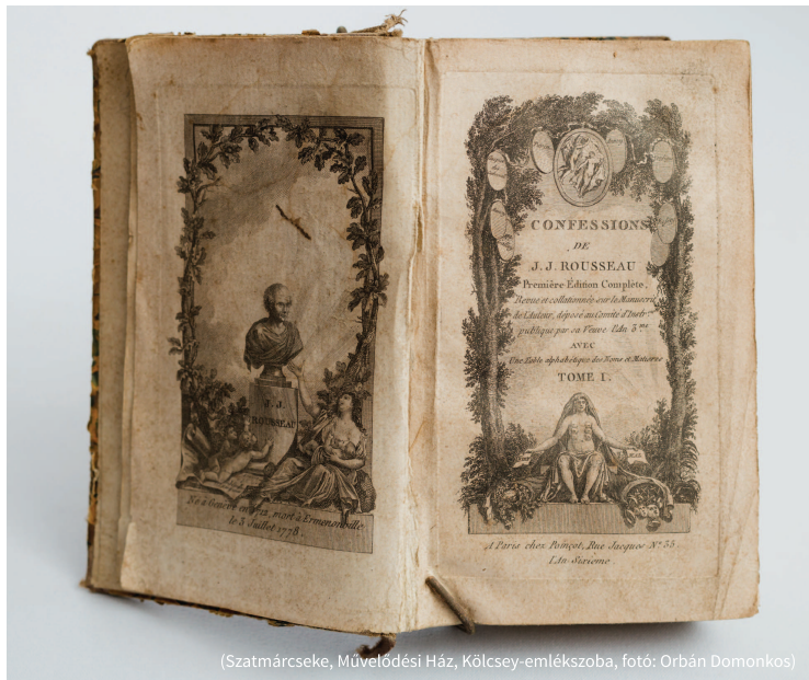
(Szatmárcseke, Művelődési Ház, Kölcsey-emléksoba, fotó: Orbán Domonkos)

tosságról, hanem egy magartás-dilemma tudatos feloldásáról van szó. A költő tehát – aki hiába vágyakozik az Ideálra, mert „üresen marad / Titkos valókért lelkesedő keble(m)” ( Egykor homályos... ) – nem szabadságvágyát tagadja meg, amikor feledni igyekszik „múló álmait” ( Ideál ). Éppen ellenkezőleg: „a tompa nyugalomtól” ( Gyöngé kézzel ), a hamis harmóniától menekül, miután felismeri, hogy a poézis kínálta harmónia nem feltétlenül a szabadságvágy teljesülése. S ez a felismerés korszakos jelentőségű fordulatot készít elő. A Gyöngé kézzel című vers sóhaja: „Ó sors, futhatnék bár veszélyes pályát / Vérzenéd bár, ó sors szívemet” és a Géniusz száll... önbiztatása: „szállj királyi sasként égi pályán / Szárnyaidnak nyíl szokatlan út” már a szabadság lehetőségektől elválaszthatatlan létkockázat vállalásának készségéről tanúskodnak.