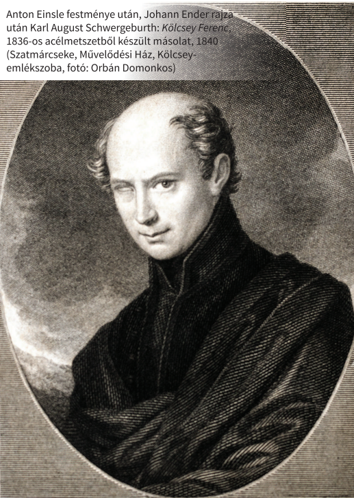
Anton Einsle festménye után, Johann Ender rajza után Karl August Schwegelburth: Kölcsey Ferenc, 1836-os acélmetszetből készült másolat, 1840 (Szatmárcseke, Művelődési Ház, Kölcsey-emlékszoba, fotó: Orbán Domonkos)

Az Andalgások című költemény (1811) költészetünk történetében először keres magyarázatot arra: miért van az, hogy a magyar költő nem bocsátkozhat olyan önfeledt szellemi kalandokba, aminőkre szerencsésebb égtájak boldogabb poétái bármikor vállalkozhatnak. A huszonkilenc strófában adott válasz – prózára fordítva – így summázható: az önmagába zárkózó lélek csak akkor érheti el célját, a harmóniát, ha a szellemi univerzum, amibe felemelkedett, nem ellenpontja, nem tagadása, hanem természetes folytatása: része, kiegészítője annak a hétköznapi világnak, amit maga mögött hagyott. „Boldog, kinek szép hont adának / A sors örök törvényei / Hol géniusz szelíd nyomának / Láttatnak nyilván jelei” – ám mi nem lehetünk boldogok. Nem lehetünk, mert „Itten vérző honunk vidékin / Nyögő szél érvén kebléhez / Pusztult váraknak omladékin / A Múza búsan tévedez.” Az Andalgások költője nem azért esedezik, hogy a géniusz intésére feledni tudja „vérző honunk vidékét”, hanem azért, hogy „Vegyék fel ömlő hangjainkat / Kárpát kinyúló szirtjai”, s hogy „Berkeink, mint Széphalom virányi / Elysionná váljanak”. Ismét prózában: nem a hétköznapi világból való kiemelkedést, hanem a hétköznapiság felemelését tűzi ki céljául ez a költői magatartás. Ismétlem,