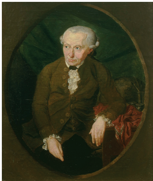
Johann Heinrich Stobbe (Doebler nyomán): Immanuel Kant, olajfestmény, 31 x 36,8 cm, 1791 (Duisburg)

Kölcsey bölcséleti tájékozódása annak a generációnak az útkereséséről szól, amelyik a francia felvilágosodás szellemi örökségéből igyekszik átmenteni annak észelvű világmagyarázatát és a közéleti cselekvésre ösztönző morális impulzusát, de az enciklopédisták mechanikus materializmusában, természettudományos racionalizmusában és a forradalom vezéralakjainak erőszakelvű ideológiájában már nem talál sem kielégítő magyarázatot, sem használható receptet kora léteproblémáira. Olyan kérdésekkel szembesül ez a nemzedék, amelyekre korszerű választ csak Kant kritikai filozófiája és Fichte nagy tettekre ösztönző morálbölcsellete tudott adni. Kölcsey titkához akkor