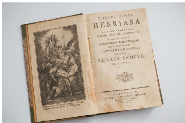
(Szatmárcseke, Művelődési Ház, Kölcsey-emlékszoba)

Az egyéni hajlamok és a filozófiai hatások egymásba fonódása persze nem eredményezhetett volna olyan szuggesztív erejű szellemi teljesítményt, amilyené Kölcsey életműve vált, ha az nem lett volna összhangban a magyar értelmiség egyik letragikusabb sorsú nemzedékének történelmi tapasztalataival és helyzettudatából formálódó stratégiájával. Látnunk kell, hogy azok a világnézeti és történetfilozófiai axiómák, amelyek – ifjúkori stúdiumainak (Kölcsey Ferenc kiadatlan írásai) tanúsága szerint – már a 18 éves költőben megfogalmazódnak, egyfelől a Martinovics-féle mozgalom vérbefojtásának, másfelől a terrorba és imperializmusba torkolló francia forradalmi dinamikájá is), a német idealizmus bonyolultabb, átteleesebb kapcsolatot látott