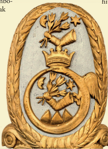
A Kölcsey család fából faragott, színezett címere a református templom ülőpadján (Szatmárceke,)