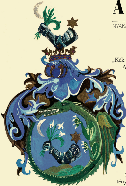
A Kölcsy család címere (Ámosd, Kölcsy Ferenc Emlékház)

„Kék alapszínű kerekded pajzs, amelyet farkába harapó zöld színű sárkánykígyó övez.