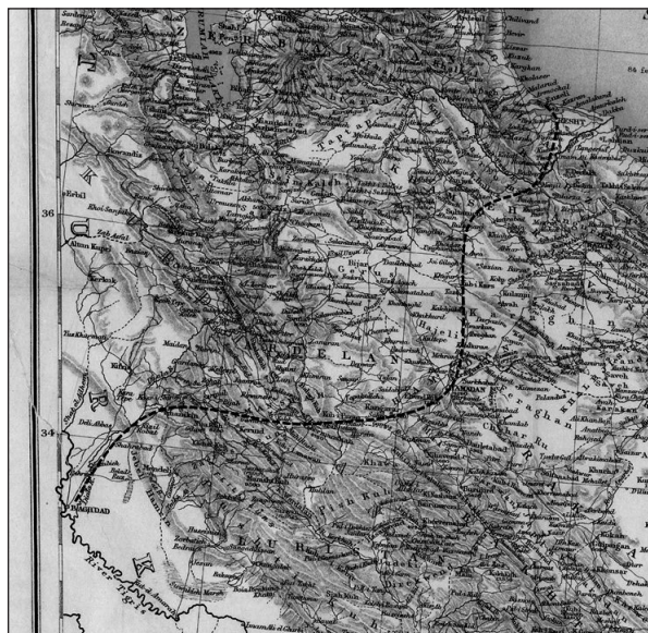
1. ábra. A kaukázusi kiképzőmisszió hozzávetőleges útvonala Enzelibe, 1918. január–február

Zavarosak voltak a hírek Kúcsek kán britekhez való viszonyáról. Az egyik brit ügynök garanciát kapott tőle, hogy átengedi a gépkocsioszlopot, 51 más beszámolók szerint Kúcsek kán harcosai támadni kívántak, ám nem kaptak garanciát Enzeliből, a visszavonuló orosz csapatok legközelebbi központjából arra, hogy az orosz csapatok nem fognak beavatkozni, ha a menetoszlopaik között manőverező angol gépkocsioszlopot támadás éri. 52 Ebben az esetben Dunsterville-nak egyszerűen az általános káosz játszott a kezére, hogy elérje Enzelit, mivel az oroszok valószínűleg nem a britek iránti jó szándékból nem adtak garanciát, hanem csak egyszerűen képtelenek voltak kontrollálni a visszaözlőket, és éppen ezért felelősséget sem tudtak vállalni a reakcióikért. Ezzel együtt elképzelhető, hogy Goldsmith valóban kapott szóbeli ígéretet a kántól, csakhogy ezt a megegyezést a dzsangalík az alakulat törbecsalására próbálták felhasználni.