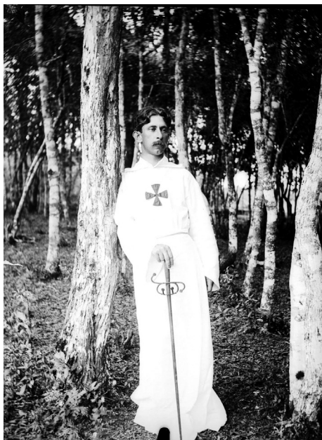
1. kép. Dario Vellozo

Dario Vellozo, aki a társaság központi figurája és eszmeiségének kidolgozója volt, a katolicizmustól indult, majd a materializmuson keresztül az okkultizmusig és az antiklerikalizmusig jutott el. Hatással voltak rá a német természettudósok, Ernst Haeckel (1834–1919) zoológus, filozófus evolúciós elmélete, Ludwig Büchner (1824–1899) tudományos materializmusa és Charles Darwin (1809–1882), valamint francia előfutára, a korai evolucionista-enciklopédista, Jean-Baptiste Lamarck (1744–1829). Vellozo kora divatos áramlatai közül többet (teozófia, ezotéria, martinista szabadkőművesség, kabbala, asztrológia stb.) is igyekezett minél inkább meg-