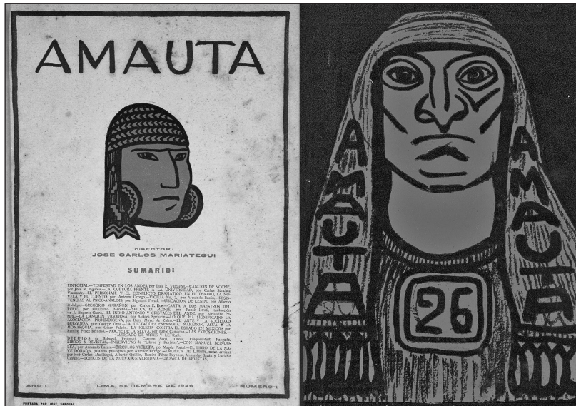
1. kép. Az Amauta 1. és 26. számának címlapja

lékkel világíthassuk meg a korszak perui baloldalának szellemi viszonyát a nyugati baloldalisághoz.