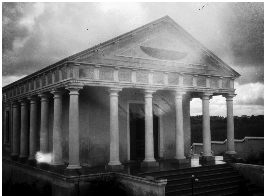
2. kép. A Múzsák Temploma

ismerni, 21 és a közös nevezőt ezekhez a püthagoreus elvekben találta meg. Szintézisét a kortársak neopüthagoreus gondolkodásnak nevezték el, amit számos saját lírai és prózai szövege 22 mellett az általa létrehozott rövidebb-hosszabb életű lapokban is igyekeztek kifejtetni és népszerűsíteni (a már említett Ramo de Acácia , valamint Pátria e Lar , Mirto e Acácia , Brasil Cívico , Pitágoras , Luz de Crótona , A lâmpada ). Nézetrendszerét irodalmi alkotásai közül legteljesebben talán nagy elbeszélő költeménye, a 300 oldalas Atlântida (Atlantisz) tükrözi, amit 1933-ban fejezett be, de csak halála után, 1938-ban jelent meg. 23