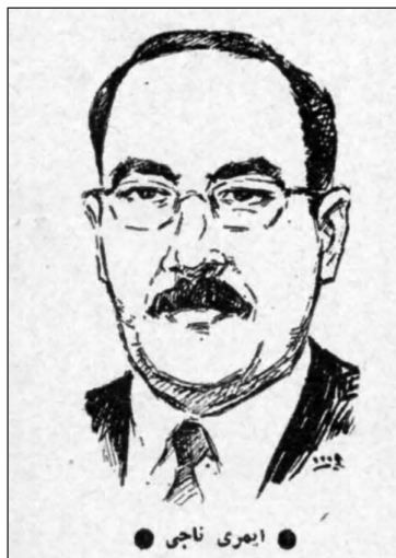
Nagy Imre. Szabáh al-Hajr, 1958. július 3.

Tudjuk, hogy a második és a harmadik vonalbeli baloldaliak ezrei mindenre találnak magyarázatot, és bárkit megrágalmaznak.