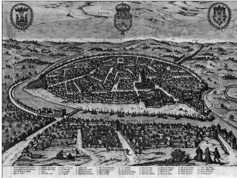
1. kép. Sevilla a 16. században