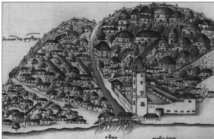
2. kép. Malakka a portugál hódítás után, 1511-ben

legértékesebb gyógynövények és fűszerek Délkelet-Ázsiából származnak, ezért a portugál korona különösen érdekelt volt abban, hogy lerakatokat létesítsen a Maláj-félsziget fontos kikötővárosában. A portugálok néhány hónapig Malakkában maradtak, egy egyezményről tárgyaltak a helyi hatóságokkal, árukat cseréltek és mindenekelőtt stratégiai természetű információkat gyűjtöttek. Hajóikat és a kereskedelmi központjukat azonban váratlan támadás érte (2. kép). Ennek következtében Diogo Lopes de Sequeira kénytelen volt néhány foglyot hátrahagyva elhagyni Malakkát. A krónikás Fernão Lopes de Castanheda többször is hivatkozik Magellánra, aki aktív szerepet játszott számos ütközetben a visszavonulás során. Tapasztalt harcosként ábrázolja, aki kitűnik bajtársiasságával. Ez különösen Francisco Serrão iránt mutatkozott meg, akinek kétszer is segítségére sietett. 35