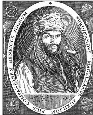
3. kép. Enrique, Magellán rabszolgája

Magam leginkább egy másik uralkodó előtt látom szívesebben: részt vesz Magellánnal a királyi felség I. Károly spanyol király (majd V. Károly német-római császár) előtt a meghallgatáson, ahol talán több is, mint „biodíszlet”, amikor bizonyítani kell a nagy fűszer-szigeteki út megvalósíthatóságát. Ma tudjuk, a baszk Elcanónak jutott a szerencse, hogy a nemesi címerpajzsán hirdesse: „Primus circumdedisti me”, vagyis ő kerülte meg először a Földet. Mint jeleztem, vele lezárul egy kör: a visszatért Victoria és a Tidorén vételezett fűszerek azt bizonyították, hogy Kolumbusz nyugati irányú terve (ami mellett a spanyol korona végig „csak” kitart) lezárta a portugálok Levantótól örökölt fűszermonopóliumát, és azt a korszakot, amelyben a portugálok mare clausum -má tehettek az Indiai-óceánt, mivel bebizonyosodott, hogy az óceánok és világtengerek átjárhatók.