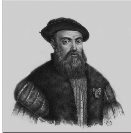
1. kép. Magellán. Charles Legrand grafikája, 1841 körül

Végül is, Magellán sem tesz mást (1. kép), mint Kolumbusz, nemcsak hazát vált, hanem annak tapasztalatait és ismereteit is magával viszi. Fontos leszögezni, hogy csak részben sértettségből, hiszen ő – ma már tudjuk, tévesen – úgy kalkulál, hogy a Fűszer-szigetek nem a portugálok kizárólagos érdekszférájában található, hanem a tordesillasi szerződésben (1494) a rivális spanyoloknak juttatott „félbevágott narancs” egyik szelete. E 15. századi Jalta atlanti választóvonalát, majd az ellenmeridián mindkét oldalát a térképeken egyre kevesebb szörny, hajó, szélrózsa, képzelt városok és lények népesítik be, a horror vacui miatt kitöltött térképészeti tér egyre inkább a földrajzi adaton alapuló ismereteknek adja át a helyét.