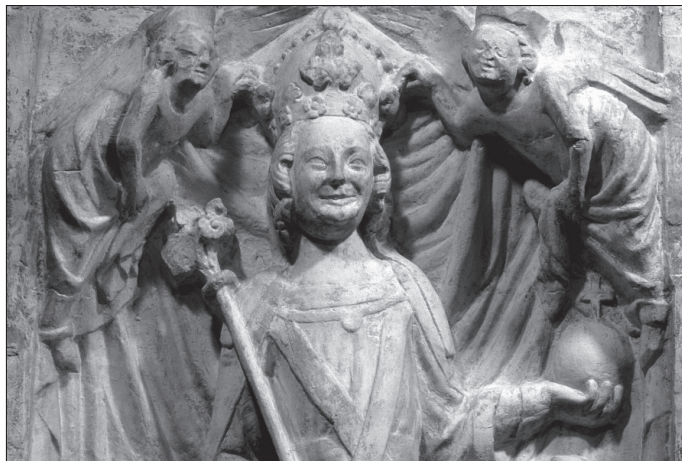
1. kép Bajor Lajos domborműve a nürnbergi városházán

A Bajorországgal szomszédos Baden-Württembergben hatszázadik évfordulója alkalmából a konstanzi zsinatot emelték idén az érdeklődés középpontjába. Míg ez utóbbi esemény a magyar történészek körében – és Husz János megégetése kapcsán talán a szélesebb közönség számára is – jól ismert, korántsem mondható el ugyanez a regensburgi kiállítás „főhőséről”. Ki is volt Bajor Lajos? Miért, milyen szempontból fontos; fontos-e egyáltalán számunkra személye és uralkodása? Alakja és története több szempontból is figyelmet érdemel. A 14–15. századot az Északi-tengertől Rómáig, a Rajnától az Elbáig, olykor a Lajtán túl is a Luxemburgok, a Wittelsbachok és a Habsburgok hármasság vetélkedése jellemezte. Mindegyik dinasztiának az volt a célja, hogy a másik kettő fölébe kerekedjen. S jóllehet a hatalmi aspirációk rendszerint a Magyar Királyság határain kívül zajlottak, az ország néha mégis az események homlokterébe került. Ne felejtjük el, hogy 1305-ben Székesfehérvárott egy bajor herceget – III. Ottót – koronáztak magyar királlyá, aki haláláig, 1312-ig viselte is címét. Továbbá Luxemburgi Zsigmond 1387. évi magyarországi trónra kerülése fontos állomását jelentette a három dinasztia hatalmi vetélkedésének, ennek köszönhetően ugyanis – a Habsburgok és a Wittelsbachok legnagyobb bosszúságára – a Luxemburgok közép-európai pozíciói minden eddiginél erősebbé váltak.