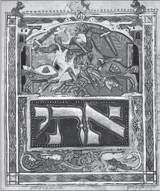
2. kép A mühlendorfi csata a budapesti Kaufmann-gyűjtemény egyik héber kéziratában (MTA KIK MS. A 384, fol. 13v)

nem nézte jó szemmel, hogy az általa el nem ismert uralkodó pápai jóváhagyás nélkül hozza meg döntéseit. Talán e szint mondható a kiállítás legkevésbé változatos egységének: a látvány gyakorlatilag üvegablakok és oklevelek váltakozására épült. A negyedik, „Császárok vagyunk” ( Wir sind Kaiser ) elnevezésű emeleten a kormányzás gyakorlati oldalát ismerhette meg a közönség. A 33 esztendőnyi uralkodás alatt Lajos egyes számítások szerint legalább 80 ezer kilométert tett meg, az általa felkeresett európai településeket a rendezők térképen is megjelölték. Sajnos azonban az öszszesítés nehezen áttekinthetőre sikeredett. Ugyanebben a szekcióban kaptak helyet a családtagokkal történő kiegyezések is. Ugyancsak itt állították ki a rendezők a 19. század elején lebontott mainzi Kaufhaus am Brand homlokzatán álló nyolc dombormű (Bajor Lajos, valamint a hét választófejedelem) élethű másolatát is.