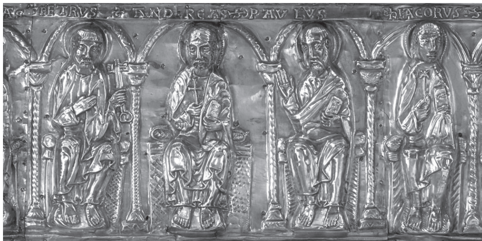
3. kép. Szent Zsigmond ereklyetartója a Saint-Maurice d'Agaune-apátság kincstárából (részlet)

litikai aktualizálásába és spirituális, művészeti átalakulásába a svájci Saint-Maurice d'Agaune-apátság ereklyegyűjteményén keresztül. A kiállításon látható 19 ötvösretek, a pompás textilek és írott források segítségével megértjük, miért vált a fekete katona a Német-római Császárság védőszentjévé, és hogyan inspirálta erkölcsi példamutatása, rendíthetetlen embersége a későbbi korok keresztényeit a császárok-tól a szerzetesekig.