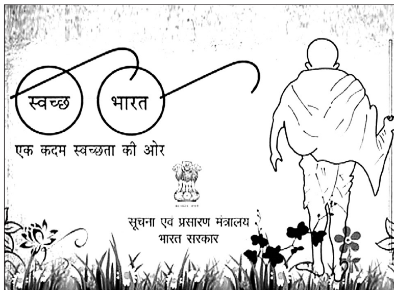
1. kép. A Tiszta India Mozgalom hirdetése

donát képező Laksmí-Narájana-templomot az érinthetetlenek számára. Az indiai állami intézményekben nemcsak Gándhí, de B. R. Ámbédkar portréjával is gyakran találkozhatunk. A New York-i Columbia Egyetem és szintén a University College London hallgatójaként végzett, kimagasló műveltségű, ugyanakkor dalit származású jogtudós India alkotmányának egyik fő szellemi atyja. 1932-ben, a korlátozott parlamentarizmus engedte keretek között egymásnak feszülő pártérdekeket figyelve Gándhínak nehezebbre esett meggyőzni punéi egyezségük (Poona Pact) előtt az alacsony kasztokat külön képviselői helyekhez juttatni kívánó Ámbédkart, hogy a muszlim elit elszakadása közben ne gyengítse tovább a hinduk pozícióját a dalit csoportok külön útra terelésével.