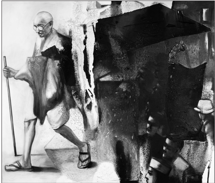
2. kép. Parés Maiti: A menet

élethűen, a parasztság férfijainak térd felett, rövidnadrág módjára megkötött dhótíjában , vállán sállal mutatja őt, míg a másik bottal, fedetlen felsőtesttel, illetve karikatúraszerűen felnagyított fejjel. A másik két alkotás életnagyságnál nagyobb. Az első geometrikus-sematikus egy katonát mintáz (szuvenir parafa dugóra emlékeztető stílusban), sötétbarna testszínnel, fehér alsóruhában és bajusszal, a jellegzetes kerek fekete szemüveggerettel. A második tulajdonképpen nem más, mint Superman, azonban Gándhí fejével, az S helyett G betűs jelzéssel feszülő mellkasán, valamint kék egyenruhanadrágja fölött az ikonikus dhótíval .