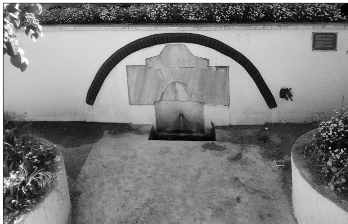
1. kép. A rodostói csorgókút mai állapota

konstantinápolyi francia követség között kialakult szoros kapcsolatnak köszönhetően a francia külügyi források betekintést nyújthatnak a magyar bujdosók és azok leszármazottai életébe is. 3 Részben ennek is köszönhetően derült fény az elmúlt időszakban egy érdekes rodostói magyar származású család, a Kőszeghyek történetére, amelyet most e tanulmány keretei között szeretnénk megosztani az érdeklődőkkel.