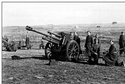
2. kép. Lőgyakorlat, 105 mm-es löveg

igaz, hogy ekkoriban a csehszlovák hadseregben nagy szimpátiával viseltettek „a zsidók függetlenségi törekvései és a szabadságukért folytatott harcuk” iránt, de a jelentkezők között voltak olyanok is, akik így akarták legális úton – nem kevés pénzügyi támogatáshoz jutva – elhagyni Csehszlovákiát. A JAFP képviselői a prágai izraeli nagykövetséggel és az IDF-fel való konzultáció után odaadták a résztvevők listáját a csehszlovák hadvezetésnek. A döntésről írásban értesítették a jelölteket, akiknek augusztus 20-ig adtak határidőt, hogy megjelenjenek a táborban. Helyszínnek az Olomouctól 30 kilométerre fekvő Libavát jelölték ki. A tábor már augusztus elején ellátta a szükséges felszereléssel. Az első csoport rendelkezésére állt 33 sátor, 200 gyakorlópuska, 330 géppisztoly, 50 pisztoly, 12 könnyű- és négy nehézgéppuska, két 105 mm-es tarack, két 75 mm-es tankelhárító löveg, két 37-mm-es légvédelmi ágyú és négy darab 82 mm-es aknavető. A Gottwald dandár kiképzése hivatalosan augusztus 23-án vette kezdetét, 305 önkéntessel. A csehszlovákok után a legnagyobb arányban a lengyelek képviseltették magukat, mintegy 48-an. A kiképzésben részt vevők majdnem fele, 495 fő már rendelkezett valamilyen harctéri tapasztalattal vagy szolgált korábban hadseregben: nemcsak a csehszlovákban (51,11%), hanem a Vörös Hadseregben (34,95%), a britben (8%), vagy a Magyar Honvédségben (1,62%). 32