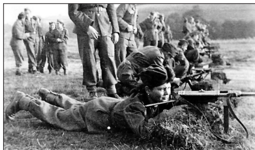
1. kép. Női lövészek kiképzése