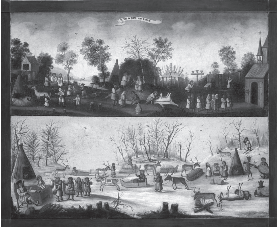
4. kép. Ezek a Lappföld szokásai című kép, 1668

harmincéves háború sanyarúságai nyomán keletkezett nemzeti elfogultság köszön-e vissza ezekben a termekben, vagy valami más, azt nehéz eldönteni. A reformációnak nem volt egyetlen „arany útja”, minden országban más és más módon valósult meg, miként az országok is különböztek egymástól. Aki a kiállítás svéd részét végignézte, egy rideg és intoleráns katonaállam, egy afféle északi Spárta képeit vitte haza emlékül. Brandenburg, a későbbi Poroszország fővárosában mindenesetre pikánsnak tetszett ez a beállítás.