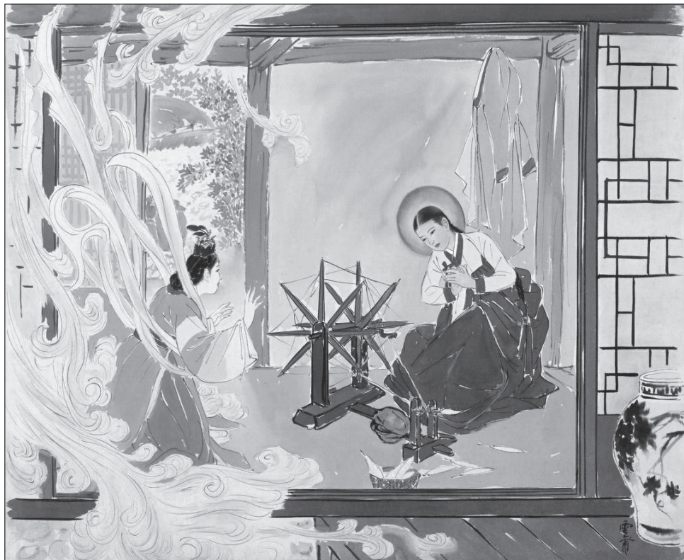
5. kép. Angyali üdvözlés Kím Ki-csang képén

több mint nyolcvan százaléka látogatja folyamatosan az istentiszteleteket. Európai szemnek különleges látványt nyújtott egy koreai festő harminc képből álló, a múlt század ötvenes éveiben készült, Krisztus életét ábrázoló sorozata, ahol az újtestamentumi jeleneteket hagyományos ruhába öltözött koreaiak jelenítették meg (5. kép).