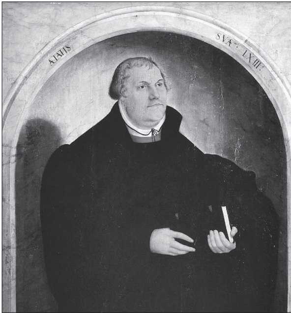
3. kép. Ifjabb Lucas Cranach Luther-képe, 1546 (részlet)

netéhez. A ciszterci apácák számára alapított egykori Szent Kereszt-kolostor és templom épülete évtizedek óta kultúrtörténeti múzeumként funkcionál. Ennek falai között helyezték el a kiállítást, a stralsundihoz hasonlóan itt is az állandó kiállítás mellett. A 16. század második felében a város és a tartomány már jó ideje az evangélikus egyház berendezkedését követte, de az apácák ragaszkodtak régi hitükhöz, vagy inkább megszokott életvitelükhöz. Az evangélikus polgárságnak és a nemességnek azonban éppúgy gondoskodnia kellett a reformált egyház szokásai között felnevelt, de férjhez nem adott lányaik életéről, mint elődeiknek. Egy tartományúri rendelettel 1584-ben a kolostort női társközösséggé szervezték, a falak között élő nők élete azonban nem sokat változott, gyakorlatilag kolostori életet éltek, csak ettől kezdve az evangélikus hitvallás szellemében. A közösség egészen a 20. századig fennmaradt.