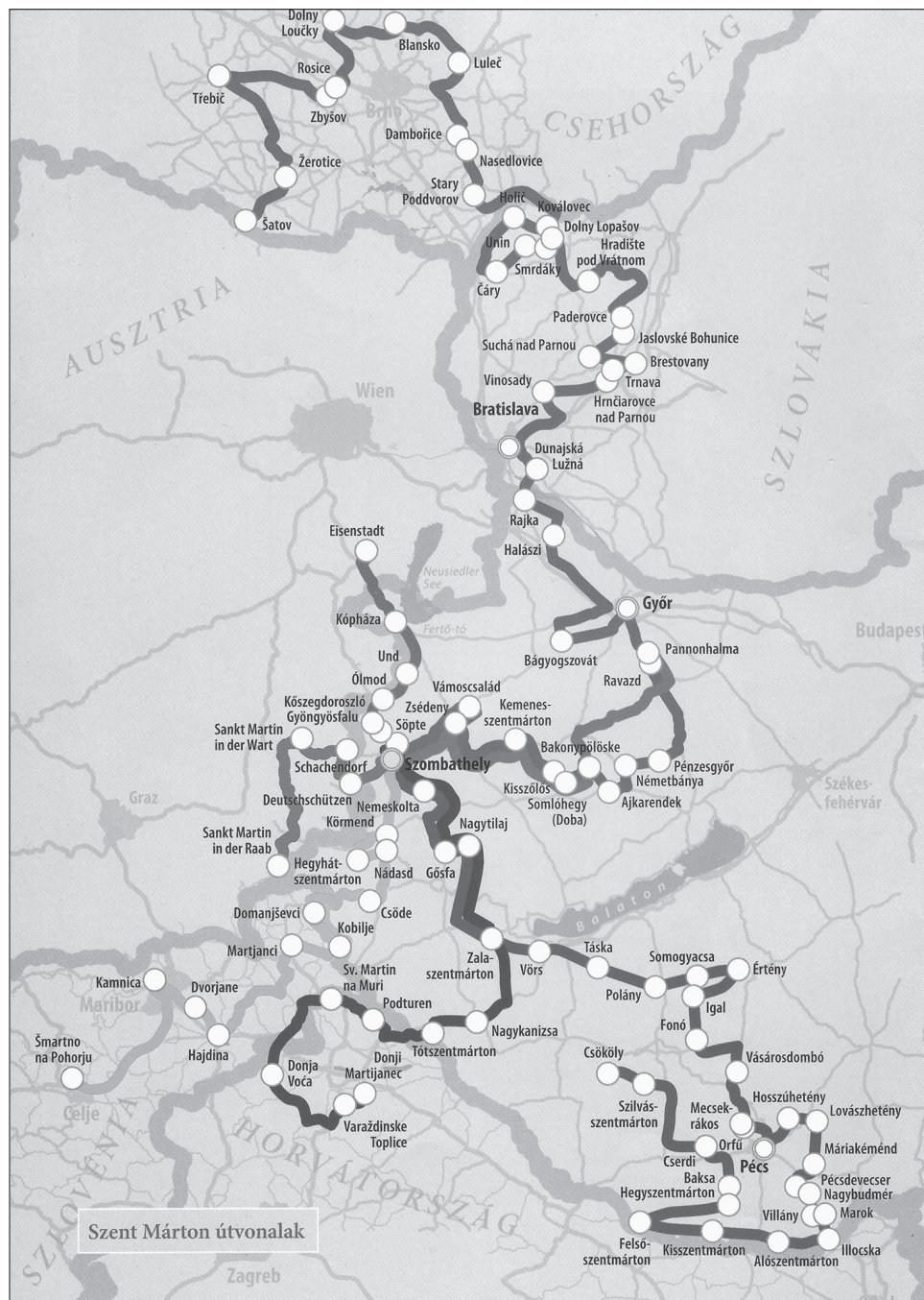
1. térkép. A Szombathelyről kiinduló Szent Márton kulturális útvonalak