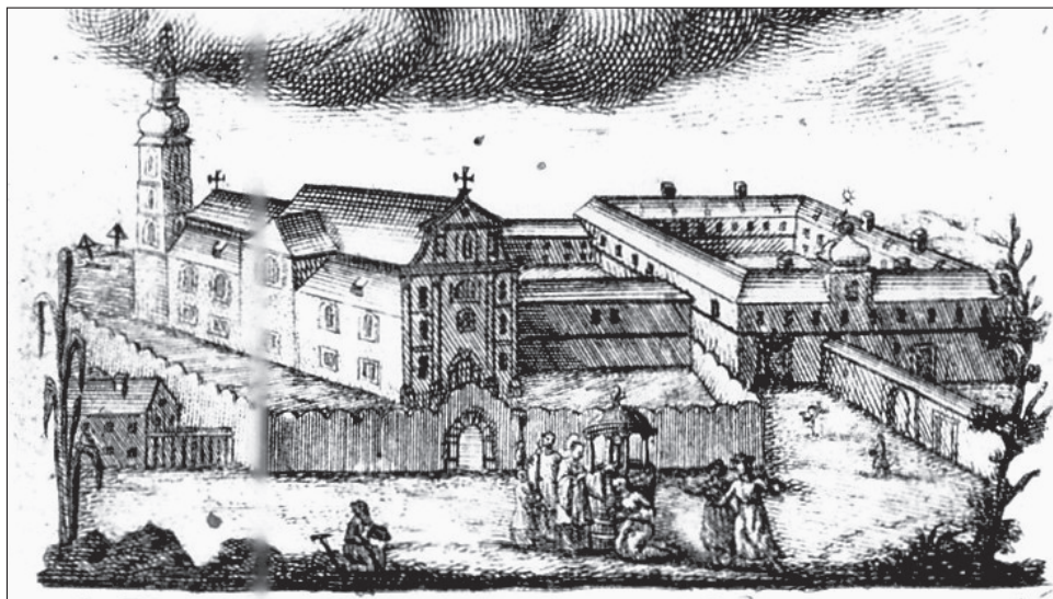
4. kép. A szombathelyi domonkos rendház, előtte Szent Márton kútja egy 18. századi metszeten

A plébániatemplom déli oldalára épült domonkos kolostor 12 falai között működik a 2007-ben megnyílt Szent Márton Látogatóközpont (3. kép), ahol információkkal, vallási és kulturális rendezvényekkel, valamint tárlatokkal várják a Szombathelyre érkező turistákat, zarándokokat és a történelmi értékek iránt érdeklődő látogatókat. 13 A Látogatóközpont kiállításai többek között az alábbi témákat érintik: Szent Márton életútja és kora; régészeti leletek és ötvöstargyak a Szent Márton-templom történetéből; nyugat-dunántúli templomokban fellelhető Szent Márton-ábrázolások (szobrok, festmények, üvegablakok); és a Márton-naphoz kapcsolódó népszokások.