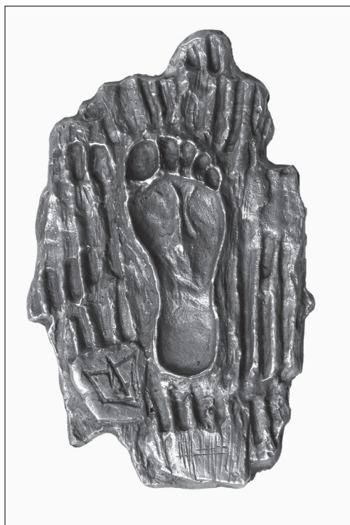
2. kép. Szent Márton bronzba öntött lábnyoma a szombathelyi Szent Márton-templom kápolnájának lépcsőjén