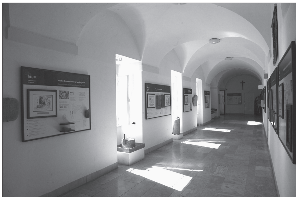
3. kép. Kiállítás a szombathelyi Szent Márton Látogatóközpontban