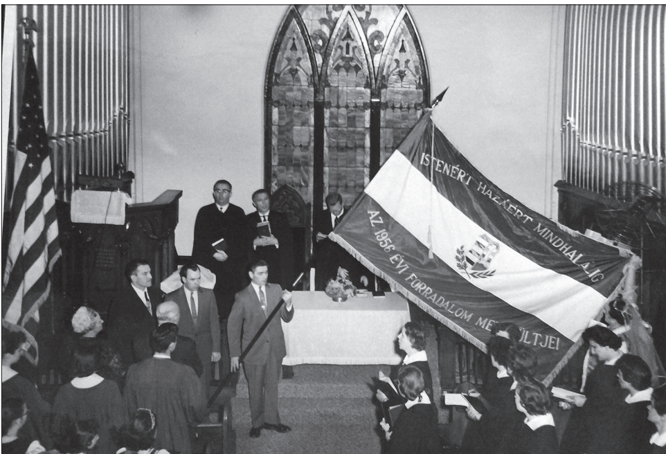
5. kép. Zászlószentelés – Chicago South (Illinois), 1957