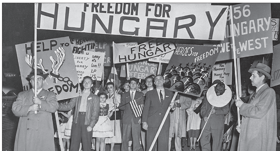
2. kép. Szabadságot Magyarországnak! Demonstráció 1956 novemberében Chicagóban

volt, mert tulajdonképpen az 1956-os forradalom után volt először jó magyarnak lenni Amerikában. Megkülönböztetett, pozitív figyelmet kaptak az USA-ban az ötvenhatosok. Érdekes ezt összehasonlítani azzal, hogy az első, agráryomor elől kivándorló nemzedéket milyen mélyen lenézték a korábban kivándorolt és módosabb angolszász amerikaiak. „Hunkey”-nak csúfolták őket, a többi kelet- és dél-európai bevándorlóval együtt. A 20. század elején gyakorta így jelentették az üzemi balesetek számát: „A múlt hónapban gyári baleset volt: öt ember és tizenkét hunkey.” 25 Emberszámba sem vették őket. A korabeli amerikai társadalomtudományi munkákban pedig ilyen kijelentésekkel találkozhatunk: „Ezek az ökörformájú emberek (az új bevándorlók) azoknak a leszármazottjai, akik mindig elmaradtak voltak. (...) Az új bevándorlók még kinézésre is mennyivel alábbvalók...” stb. 26