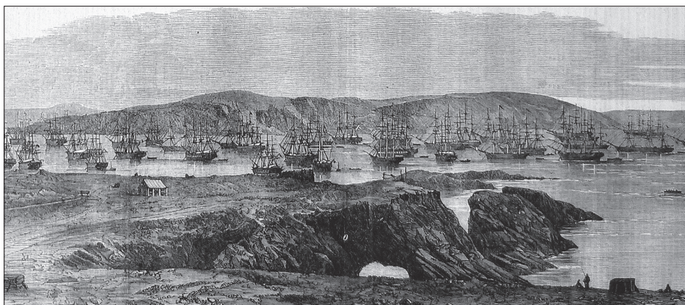
3. kép. Guanót szállító hajók a Chincha-szigetknél

spanyol-amerikai példákhoz képest a guanókitermelés jelentett különbséget a kínaiak foglalkoztatása kapcsán Peruban.