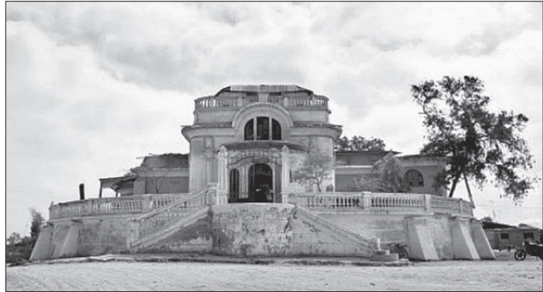
5. kép. La Viña hacienda