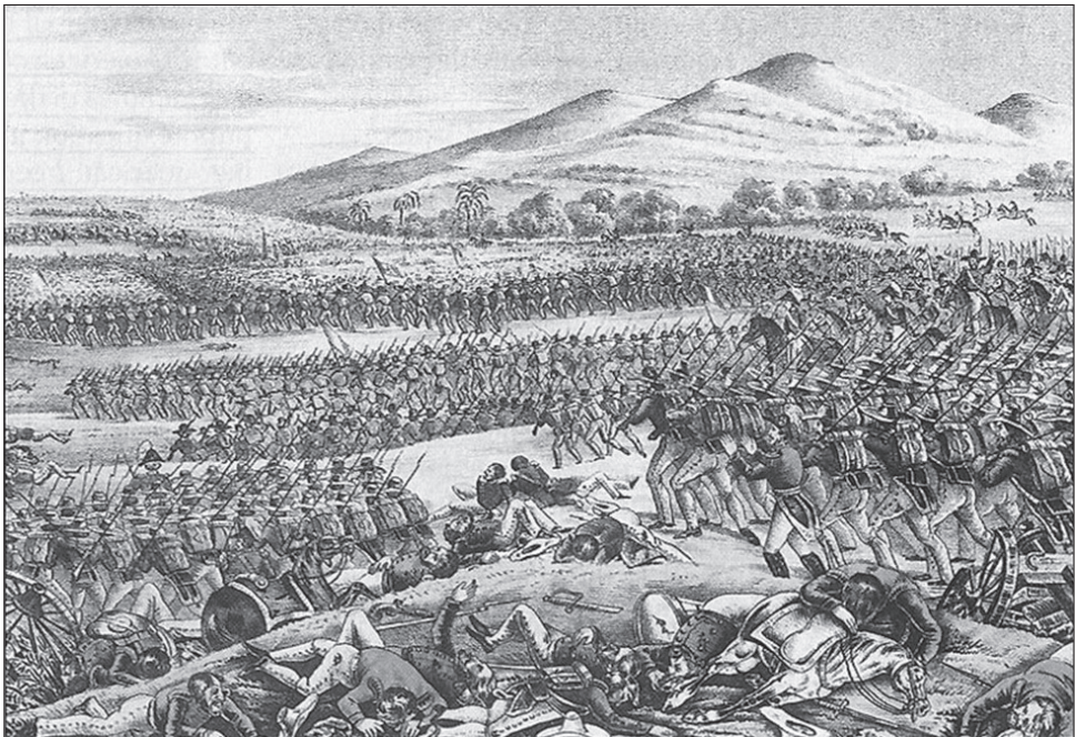
1. kép. A Buena Vista-i csata

Az amerikai kormány eredeti háborús célja a korábban kiszemelt mexikói tartományok megszerzése volt, és úgy vélte, ezek elfoglalása után, néhány fontos katonai győzelem eredményeként a mexikóiak kapitulálni fognak és teljesítik a már korábban megfogalmazott amerikai követeléseket. Erre azonban nem került sor azután sem, hogy az amerikai csapatok Új-Mexikót és Kaliforniát is ellenőrzésük alá vonták, ezért Polk elnök úgy döntött 1846 nyarán, hogy az eredményes békekötés reményében az új hadicél Mexikóváros elfoglalása. Haderőt csoportosítottak át