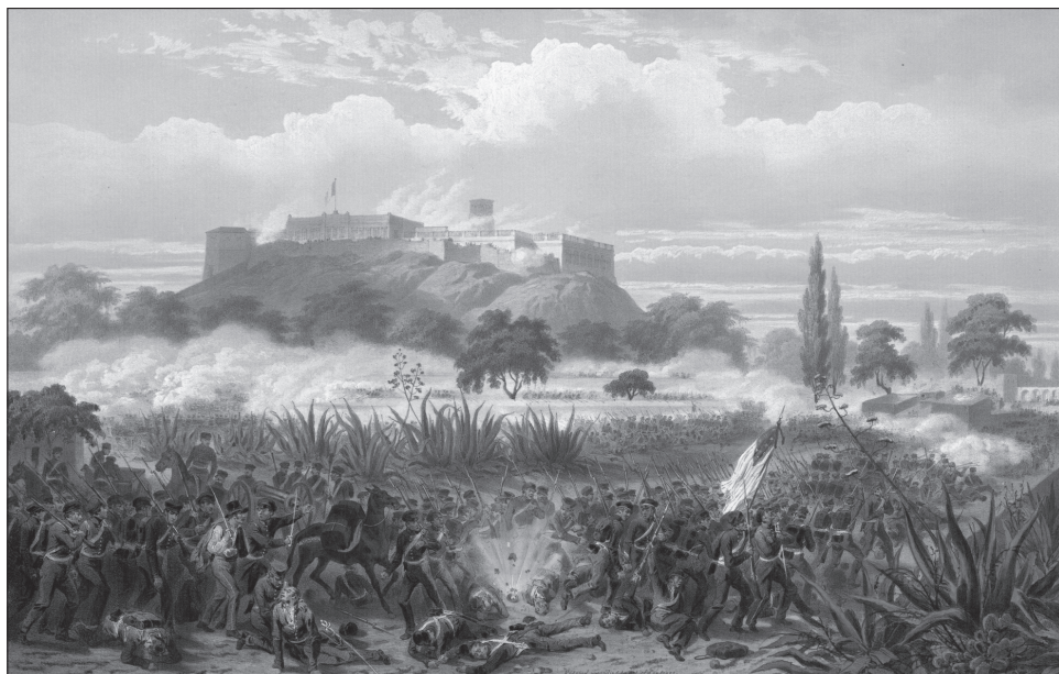
4. kép. Chapultepec várának ostroma

Mexikó második legnagyobb városát, a nyolcvanezres Pueblát. Innen közel három hónap múlva indult csak tovább. Meg kellett várnia az utánpótlást mind katonákban, mind ellátmányban. Seregéből közel háromezren kerültek kórházba, nem csupán a harc közben szerzett sebesülés, hanem különböző járványok következtében is. Mexikói oldalon sem volt jobb a helyzet. A megtépázott sereg, a kormány belső vitái, az egyes területek elszakadásáról szóló híresztelések és kisebb-nagyobb lázadások hasonlóképpen kivárára készítették őket, s nem született döntés Mexikóváros megerősítéséről sem. 21 Winfield Scott végül 1847 augusztusában indította útjuk csapatait a főváros felé. Miután benyomult a Mexikó-völgybe, Mexikóváros ellenállását több ütközetben törte meg. Győzelmet aratott Padiernánál, Contrerasnál, majd 1847. augusztus 20-án Churubuscónál (3. kép). Legendás történet, ahogyan a mexikói Nemzeti Palotát, Chapultepec várát a végsőkig védték az ott működő kadétiskola növendékei, a „Hős Fiúk” ( Los Niños Héroes ), de hiába (4. kép). 22 A szeptember 13-i győzelmet követően az amerikai sereg bevonult Mexikóvárosba.