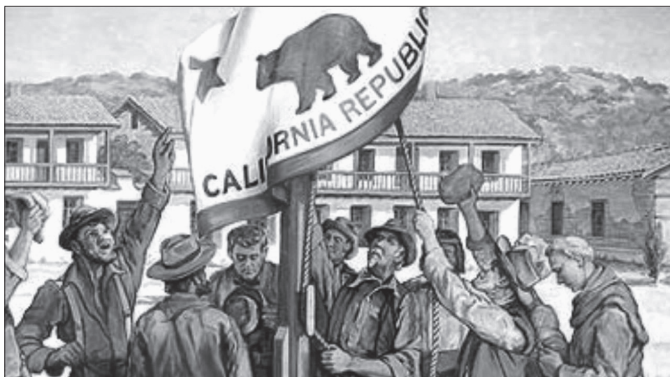
1. kép. A medve zászló felvonása

Itt érdemes megjegyezni, hogy 1847 decemberében az akkor még fiatal whig képviselő, Abraham Lincoln megkérdőjelezte, hogy a mexikóiak valóban amerikai földön ontottak-e vért. A Kongresszusban felszólította Polk elnököt, hogy nevezze meg a pontos helyet, ahol az amerikaiakon rajtaütöttek, és bizonyítsa be, hogy az valóban amerikai föld volt, vagy inkább Mexikó formálhatott rá jogot. A felvetést végül sosem tűzte napirendre a Képviselőház, de nyilvánvalóvá tette a whigek álláspontját a háború kitörésének körülményeivel és az amerikai hadüzenettel kapcsolatban. 15