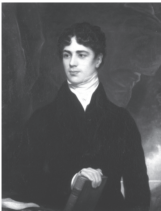
3. kép. Lord Durham

zás az volt, hogy a két tartomány egyesítésével a francia kanadai kulturális jelenlét asszimiláció útján fokozatosan eltűnik majd. Ennek megfelelően az Egyesülési Törvény korlátozta a francia nyelv használatát a Törvényhozó Gyűlésben. Bár Kanada az egyesülést követően elvben egységes formában működött, a gyakorlatban mégis két különálló részre oszlott, Nyugat-, illetve Kelet-Kanadára, lényegében a korábbi Felső- és Alsó-Kanada határait követve. A közös törvényhozásban a 450 ezer fős lakossággal rendelkező Nyugat-Kanada ugyanúgy 42 helyet kapott, mint a 650 ezer főnyi lakosságú Kelet-Kanada. Ezzel a ravasz megoldással sikerült elérni, hogy az angol nyelvű lakosság nagyobb többségbe került a testületben, mint ahogyan azt a létszámarány indokolta volna. Ráadásul a korábbihoz képest az Egyesülési Törvény olyan magas vagyoni cenzust alkalmazott a passzív választójog esetében, amely a francia kanadaiak jelentős többségét eleve kizárta a potenciális képviselőjelöltek köréből. Mindazonáltal az Act of Union mindkét országgrészben hatályban tartotta a korábban elfogadott törvényeket és az alkalmazott jogot.