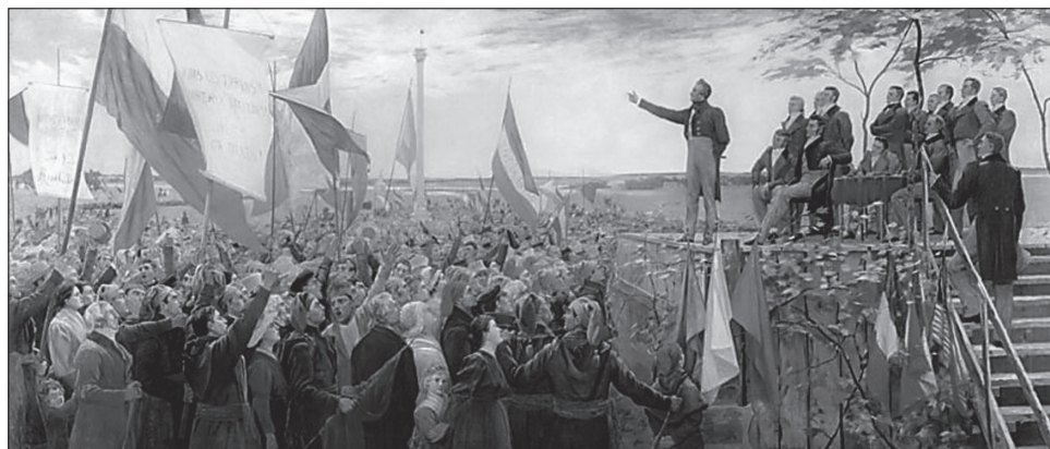
1. kép. Papineau szónokol a saint-charles-i gyűlésen. Charles Alexander Smith festménye

A katonai vereségeket követően a főbb rebellis vezetők az Egyesült Államokba menekültek, ahonnan amerikai szimpatizánsok segítségével még egy teljes éven keresztül fegyveres betöréseket hajtottak végre. A harcok 1838 novemberében mindkét tartományban a felkelők vereségével értek véget (Felső-Kanadában Prescottnál, Alsó-Kanadában pedig Beauharnois-nál). A felkelők vezetői közül néhányat kivégeztek, másokat deportáltak. Olyanok is akadtak, akik az Egyesült Államokban maradtak, ahonnan később amnesztiával térhettek vissza Kanadába. Alsó-Kanadában felfüggesztették az Alkotmányos Törvényt, 1838 áprilisában feloszlatták a törvényhozás mindkét házát, a Végrehajtó Tanács szerepét pedig egy