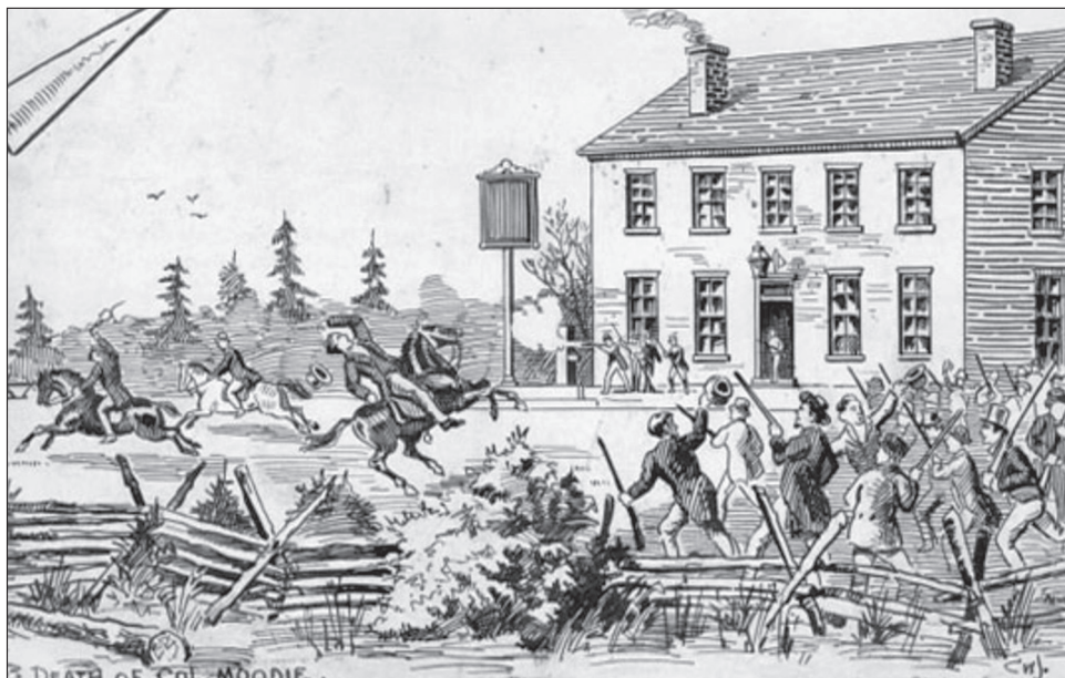
2. kép. Ütközet Montgomery kocsmájánál

különleges testület ( Special Council of Lower Canada ) vette át, amely egészen 1841 februárjáig hivatalban maradt.