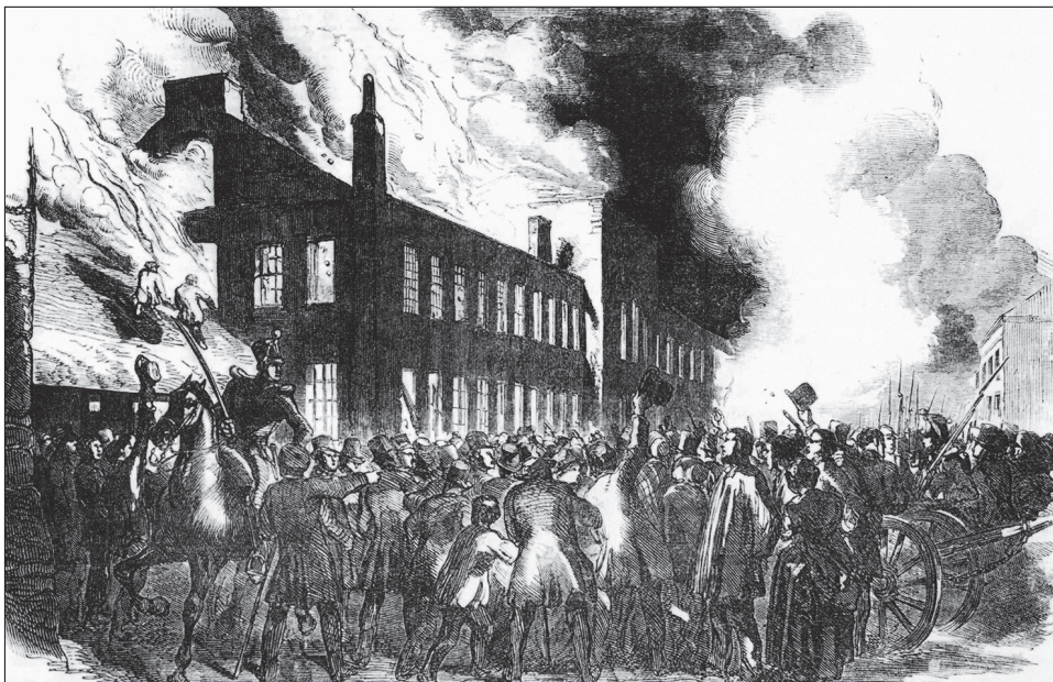
4. kép. A montreali törvényhozás égő épülete a London Illustrated News hasábjain

futottak. A csőcselék betört az épületbe és összetörte a berendezést. Valaki beült a házelnök székébe és elordította magát: „A házat felosztatom!” Nemsokára lángokban állt az épület, és reggelre már csak az üszkös falak álltak (4. kép).