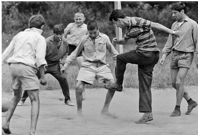
Foci állami gondozott gyerekekkel. Tiszadob, 1960-as évek