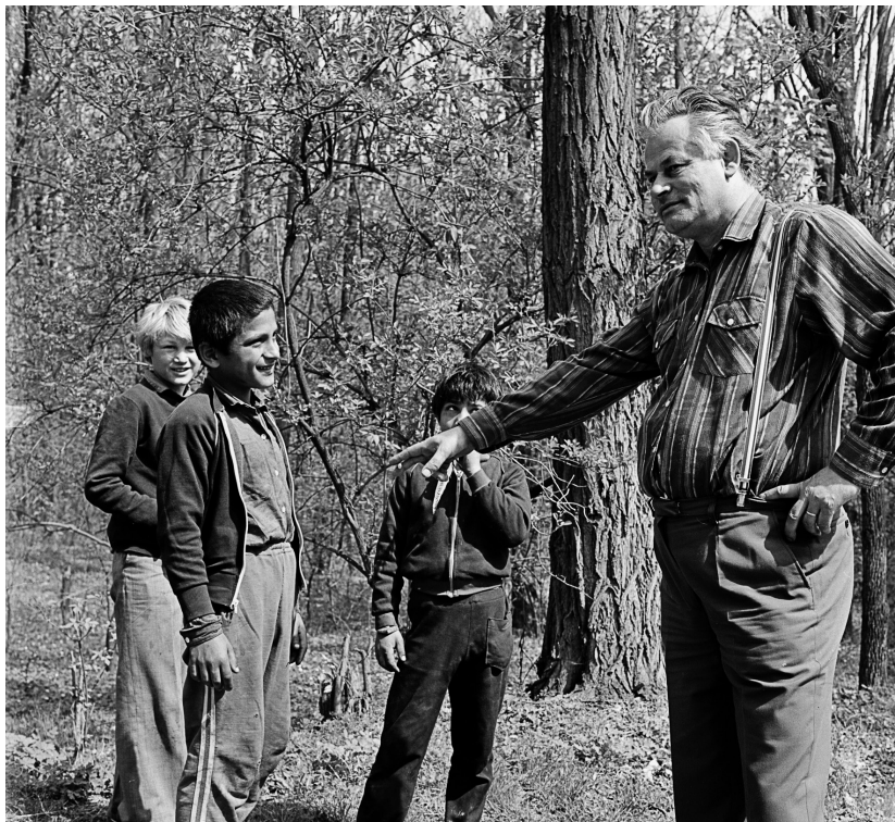
Állami gondozott gyerekekkel Tiszadobon