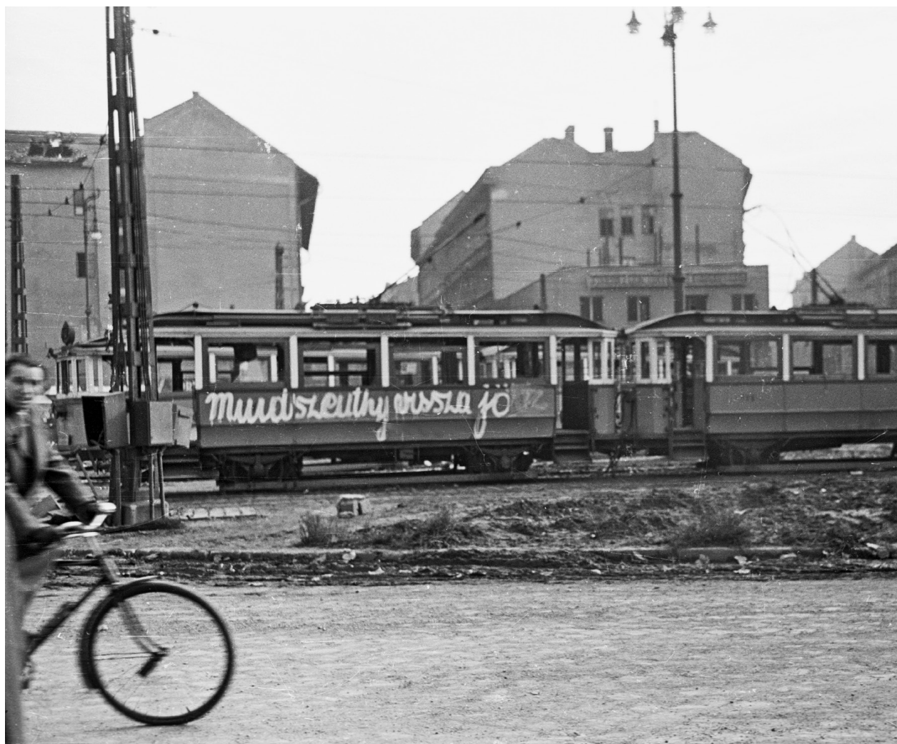
Kálvin tér

Hangsúlyoznom kell azonban a tennivalók tárgyi foglalatait: jogállamban élünk, osztály nélküli társadalom, demokratikus vívmányokat fejlesztő, szociális érdekektől helyesen és igazságosan korlátolt magántulajdon alapján álló, kizárólag kultúrnationalista elemű nemzet és ország akarunk lenni. Ez akar lenni az egész magyar nemzet. Mint a katolikus Egyház feje viszont kijelentem, hogy – amint azt a püspöki kar 1945-ben közös körlevélben kijelentette – nem helyezkedünk szembe a történelmi haladás igazolt irányával, sőt, az egészséges fejlődést mindenben előmozdítjuk. Azt a magyar nép természetesnek találja, hogy nagy múltú és nagy értékű intézményeinkről gondoskodni kell. Ugyanebben a minőségemben továbbá megemlítem, az ország hat és fél millió katolikus híveinek tájékoztatására, hogy a bukott rendszer erőszakának és csalárdságának minden nyomát egyházi vonalon felszámoljuk. Ez nálunk ősi hit-