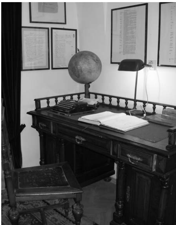
Íróasztal az emlékszobában

ócsárolják. Az őszinte, igaz hazafi egész életében megszenvedti hazája elmaradottságát, a hazáét, melyet nem szűnt meg szeretni, s ahonnan elmenekült. Szabad szellem lévén Márai megveti az intézményt mint olyant; a nemzetről, a nyelvről, a közösségről vallott nézeteit nem helyezi politikai keretekbe. Elítéli a háborút, melyben oly sok veszteség érte, viszont érzékeli az ideológiák meg a politika romboló erejét, ami hatásában nem marad el a fizikai értelemben vett rombolástól. Nem kevésbé jelentősek a szerzőnek a költészetről vallott megnyilatkozásai. Márai a műalkotás etikai értékét és