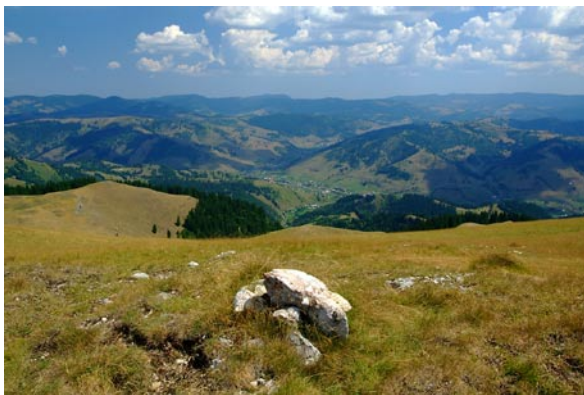
Kilátás a Naskalat „tetejéről”