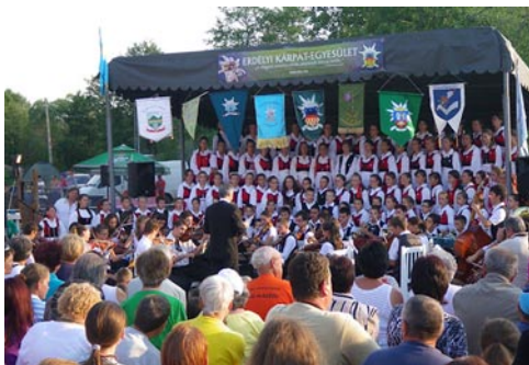
A Szentegyházi gyermek filharmonikusok