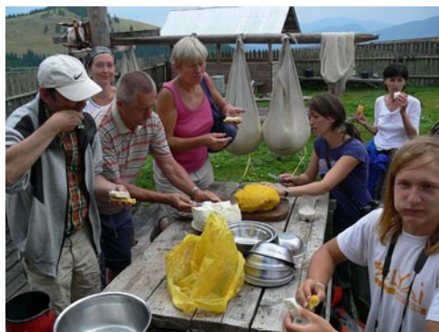
Bio orda, bio puliszka

A harmadik túra az előzőhöz hasonlóan a Borsai hágóról indul. Csak kb. 150 méter az emelkedő az Asztal rétig, könnyen felismerjük, mert szélesen és hangulatosan terpeszkedik a Gargaló alatt. Gyakor-