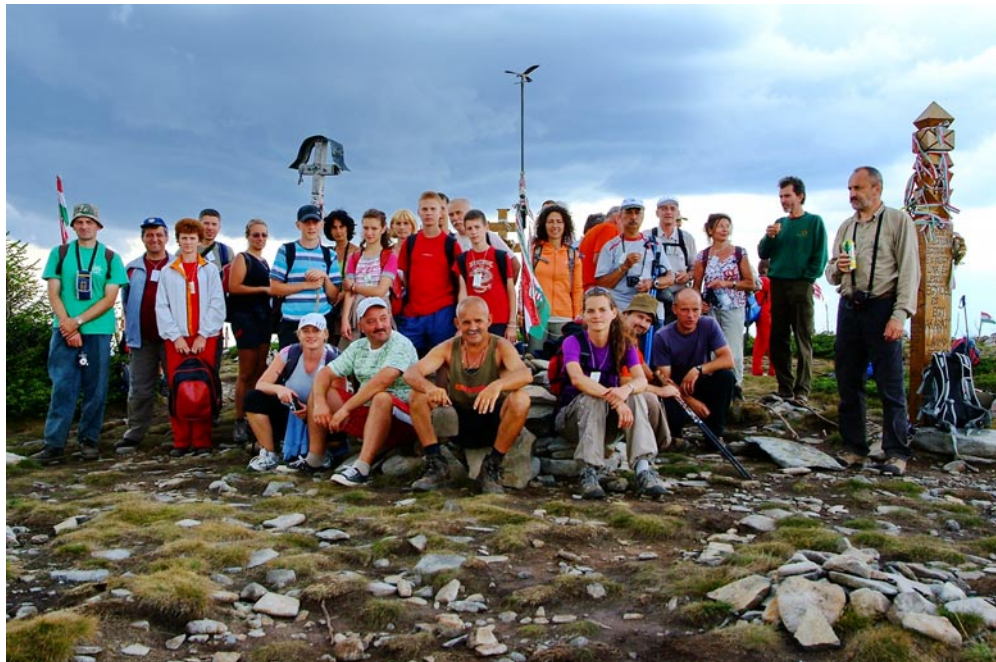
Gerinctúrázó csoportunk a Madarasi Hargitán