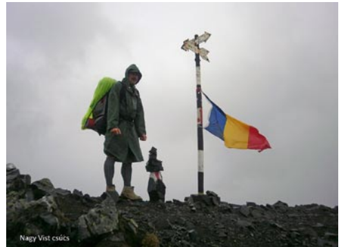
Nagy Vist csúcs

Másnap felkapaszkodtunk a Dregus-gerincre (2298 m), igyekeztünk megtalálni a piros ponttal jelzett utat, miután sehogyan sem akarta mutatni magát, úgy döntöttünk, hogy csak a kék jelzésből válhat le, ezért elindultunk lefelé a Szombatfalvi menedékház irányába. Megérkezett az eső, tartós útítársnak mutatkozott és nem könnyítette utunkat. A Szombatvölgy már ismerősként üdvözölt bennünket, itt derült ki, hogy egyik túratársunk megcsúszott és beverte a térdét, ezért kénytelen volt leereszkedni a menedékházhoz.