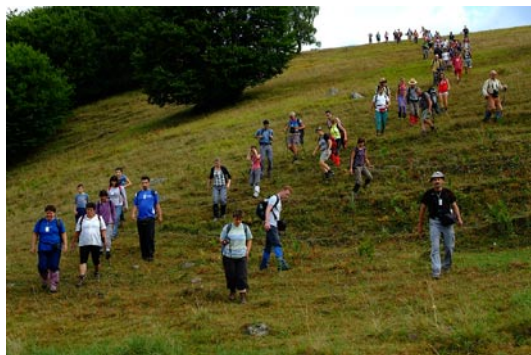
Almás felé rövidítünk