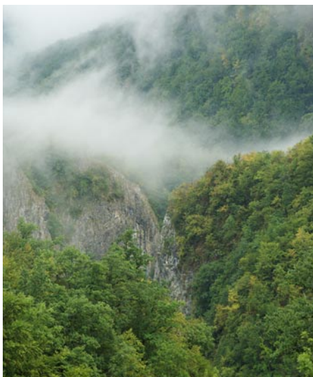
Vargyas-szoros felső bejárata eső után