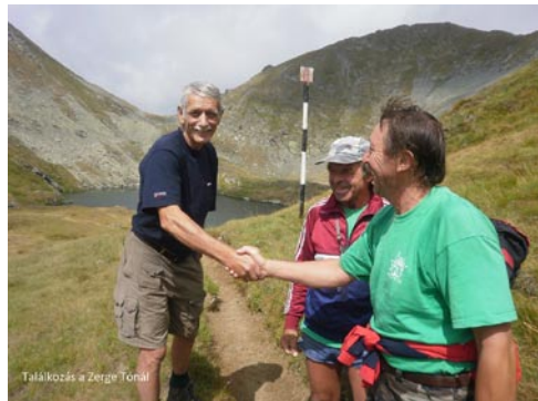
Találkozás a Zerge tónál

A Nagy-Árpás (2468 m) megmászása után könnyedén ereszkedtünk alá a füves területen, majd a