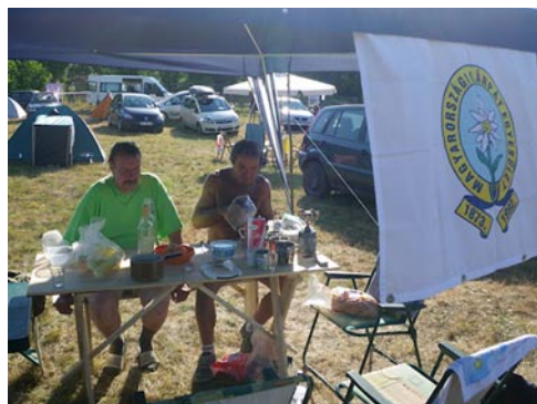
MKE központ a táborban

Végre! Elindultam a XXI. EKE Vándortáborba a Hargita lábánál fekvő Szentegyháza termál fürdőhöz közeli Majzosra. Már 1999-ben készültem a vándortáborba, de csak most sikerült oda is érnem. Budapestről reggel 8-kor indultunk, ez késői indulásnak bizonyult a hosszú, 9 és fél óras út miatt. A magyarországi szakaszon még csak haladtunk – az autót kikerüli a településeket – a romániai szakaszon a Kolozsvárt elkerülő és épülő autópályán kívül minden településen át kell hajtani. Mindjárt lemaradtam első EKE tábor megnyitómról. No, a sátrakat még világosan fel tudtuk verni.