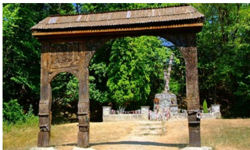
Orbán Balázs székelykapu