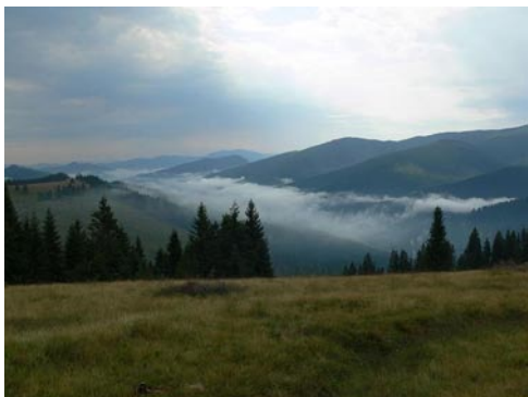
A reggeli felszálló pára

látványtól továbbhaladni. Füves csoportok tarkította füves hegyoldalak mellett megyünk, majd a hegyek irányába beigazított heverészás alatt megebédeltünk. Áfonyaérés ideje lévén folyamatosan tömhattük magunkat a gyümölcscsel, csak hát manuálisan szedve ez kissé szaporátlan.