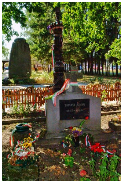
Tamási Áron sírja, Farkaslaka