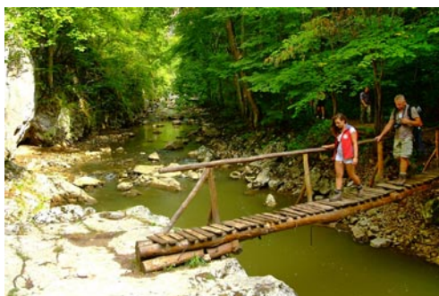
Átkelés a Vargyas patakon a Lócsúrhöz