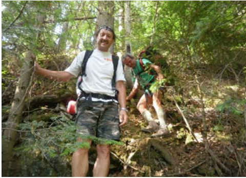
Ereszkedés az erdőben

Elindultunk vidáman, hisz egy tökéletes széles erdőkitermelői úton haladtunk, később egy két helyen átkeltünk a patakon, majd hirtelen eltűnt az út. Ez még nem jelentett problémát, mivel a jelzések továbbvittek bennünket, hol a jobb, hol pedig a bal parton.