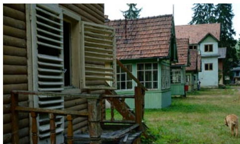
A kifosztott kiralyfürdői diáktábor épületei