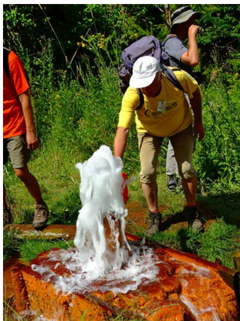
Időszakosan működő borvízforrás