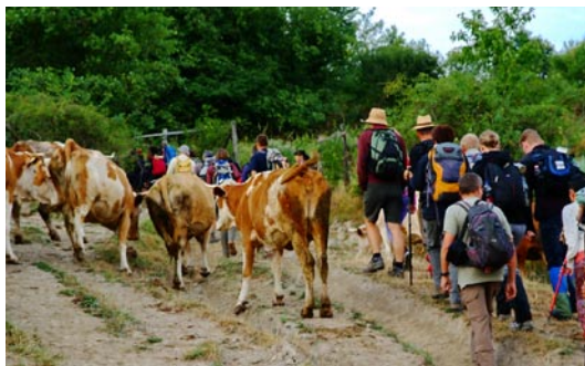
Lövétéről indultunk a szorosba