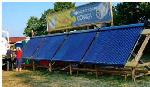
és a napkollektorok a melegvíz előállításához