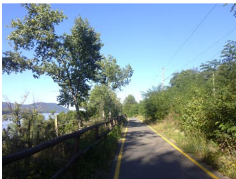
Tökéletes minőségű bringaut