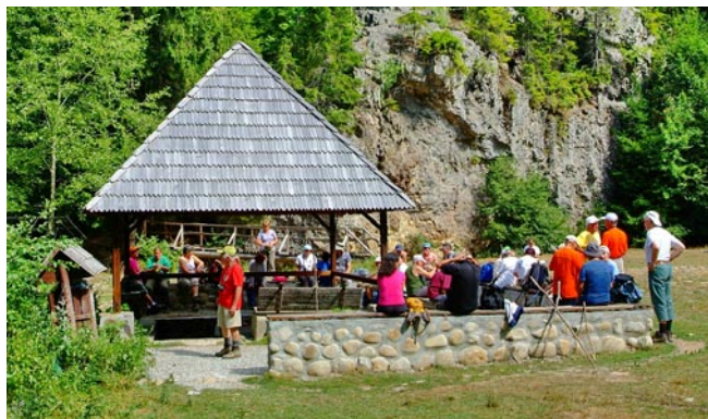
Túracsoportunk a Festő borvízforrásnál