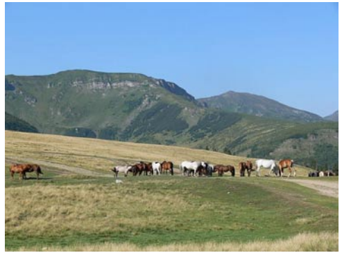
Útban a Gargaló csúcsára

Ma már másodszor is leülünk a Lóhavasi vízeséshez vezető meredekre, és onnan bámuljuk a kékre változott hegykoszorút. Mindenki újra megbabonázva. Nem is érdemes ennél tovább fokozni a jót, mert többet már nem lehet befogadni, annyi széppel találkoztunk eddig. Elindulunk lefelé. Én abban