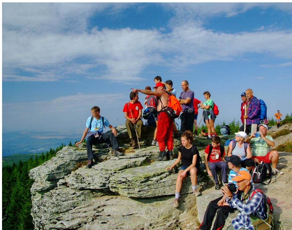
Gerinctúrás csoportunk a Bagolykő magaslatán

E seménydús nyári beszámolóink gerincét erdélyi útjaink képezik. Egri csapatunk a Radnai-havasokban gyalogolt, az MKE 39 tagja pedig részt vett a Hargita lábánál megrendezett EKE vándortáborában. Bringásaink a Duna vonalán csodálták a tájat, síszakosztályunk borszönyi munkatúrával megkezdte a téli felkészülést. Ezúton is köszönjük a szervezők munkáját!