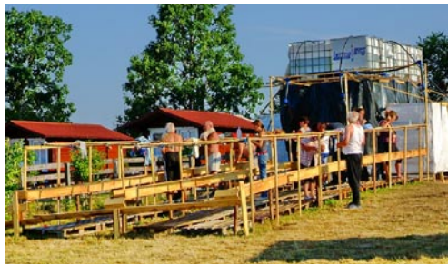
Tábori tisztálkodó hely