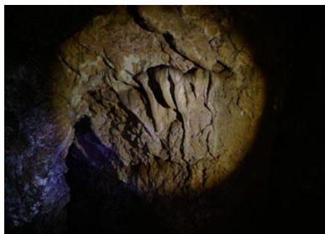
Az Orbán Balázs barlangban