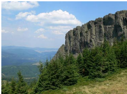
Kakastaréj – nekem nyúlfej

A korai keléstől kábultan, a holminkat a táskákba halmozva kászálódunk az utolsó nap útjának eseményeihez. A busz ugyanúgy halad Máramaros falvai mentén, mint odafelé. Ünneplőbe öltözött emberek mennek a vasárnapi misére, itt még hordják a helyi viseletet. Örvedetes, hogy van még hely, ahol vissza lehet menni az időben. Eszembe jut a városokra jellemző hullámszerűség, csak hogy ez a metrók lépcsőin vonuló tömeget jelenti, a villamosok zsúfoltsága, a kocsikkal telt többsávos utak. Meg a fűnyíró, mert a városi ember erkölce az istenadta fűvet csak néhány centisen viseli el, és ezért hangrobbanást létrehozó zajjal teszik „emberivé” a természet alkotását. Én olyankor biztos vagyok benne, hogy ránézés nélkül ki tudnám választani melyik majom a legőrültebb.