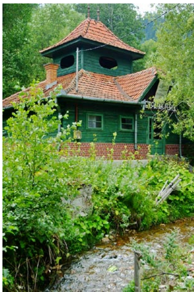
Sötétpatak fürdő, nem üzemel