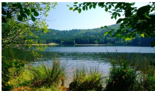
Szent Anna tó