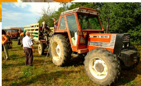
Madarasi Hargita – tábor közötti traktoros visszaút jó hangulatáról a gyergyói barátaink gondoskodtak