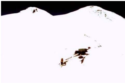
Az Elbrusz két csúcsa