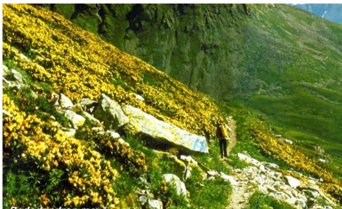
Sárga rododendron bokrok között

A lefelé tartó mászó út is törekeny, málló