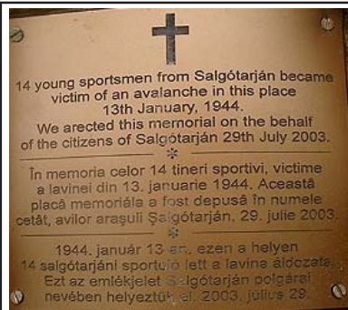
Az emléktábla