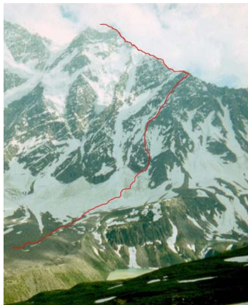
Nakra-tau pillére és gerince

igénybe lettek véve és Achilles-inunk ugyancsak sajgott, mire elértük a gerinc gránit szikláit. Innen egy darabig könnyebbé vált a mászás, de minél feljebb értünk, annál lazábbá vált a kőzet és így egyre nagyobb óvatosságot igényelt a feljutás. Ennek ellenére jól haladtunk és a 12 órás rádiójelentkezésre már mindnyájan a pillér tetején pihentünk. Jó érzéssel jelentettük, hogy mindenki jól van és indulunk tovább a csúcsra. A rendelkezésünkre álló német hegy-mászó kalauz szerint innen 2/a nehézségű, te-