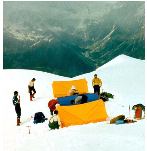
Táborunk a gerincen

De ez az engedélyezés sem ment zökkenőmentesen. Egyik társunk, egészségi állapotát az orvos kifogásolta. Véleménye szerint a pulzusa nem állt vissza a szabályos állapotra, megfelelő időn belül. Mi tudtuk ennek okát – legalább is sejtettük – de az orvos, ezt nem akarta tolerálni és csak hosszabb huza-vona után engedélyezte részére a túrát.