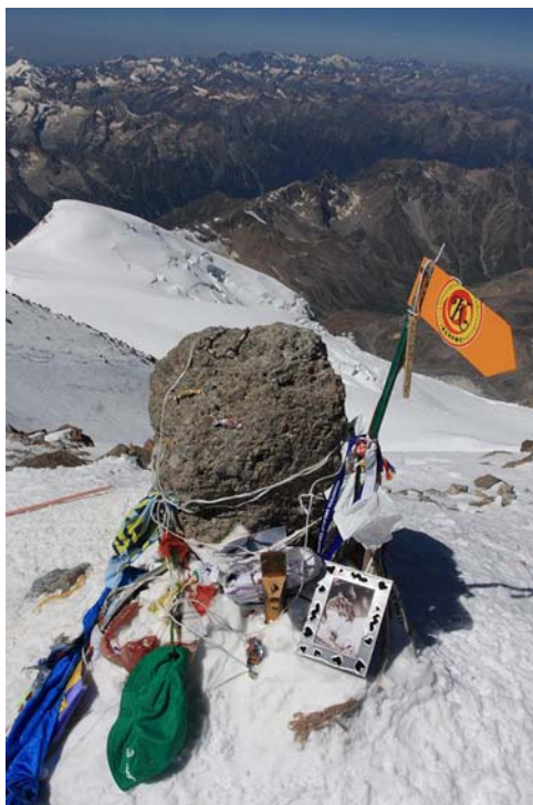
Elbrusz csúcskő 2009-ben fotó: Mocsári László, KEM

Ezek után, természetesen gratulálok a sikeres csúcsmászáson kívül a szervezéshez, valamint a kiadvány szép kiviteléért is, kívánva még sok-sok hasonló vállalkozást és sikereket a hegyekben.