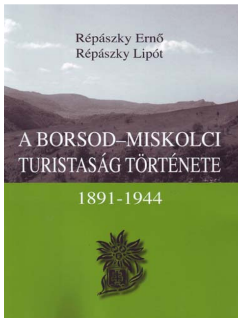
A könyvborító és egy fotó a 240. oldalról