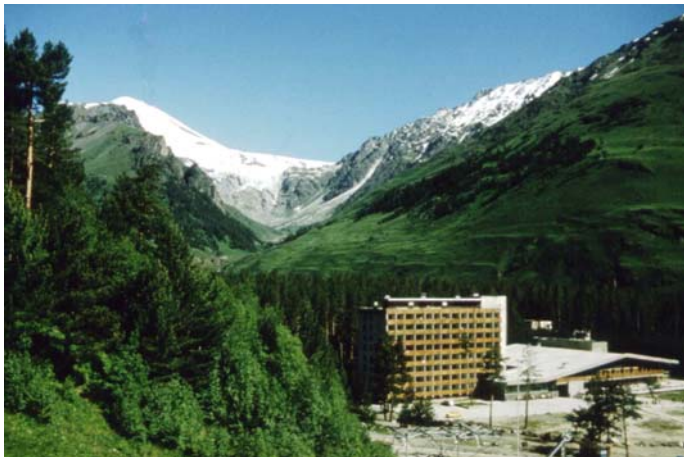
Cseget szálló és az Elbrusz K-i csúcsa

Késő délután állt meg utóbuszunk, mintegy 200 km megtétele után a Cseget szálló főbejárata előtt. Kicsit meglepődtem. Mintha va-