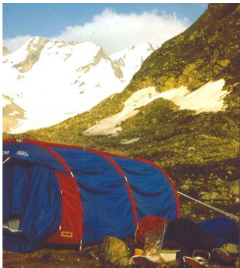
Sátrunk a „Zöldvendéglőnél”

rövid üzenet várt: „elmentünk a Dzsailikre (5/ b nehézségű) 15-én jövünk vissza”. Sok sikert fiúk – gondoltuk – mi pedig megyünk a „Zöldvendéglő”-höz, a Dzsantugánra, határoztuk el.