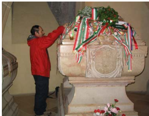
A Rákóczi kriptában koszorút helyeztünk el

A középiskolás korosztályt egyesületünk TEDOT-on ezüstérmes 5 fős csapata képviselte (a versenyről cikk az előző számban). Szintén jutalomként jöttek az Eszterházy Gyakorló Iskola hetedikesei.