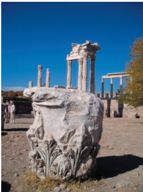
Pergamon: Trajanus templom

alátemetve várja, hogy a régészek ásója a felszínre hozza. A német születésű Heinrich Schliemann élete vágya teljesült, mikor megtalálta Homérosz Trójáját. Schliemannt nevezhetjük a régészet úttörőjének, de egyesek szerint kontár és gátlástalan fosztogató. 1870-ben kezdett ásni, mint lelkes Trója rajongó és 1873-ban rábukkant az un. „Priamosz kincsekre”. Az arany és ezüst ékszerek, melyeket kicsempészett Trójából azonban nem Priamosz király kincsei voltak, de e néven járta be hírük a világot. A gyűjtemény egy részét Berlin elestekor az oroszok ellopták és 1996-ban került elő az oroszországi Puskin Múzeumban.