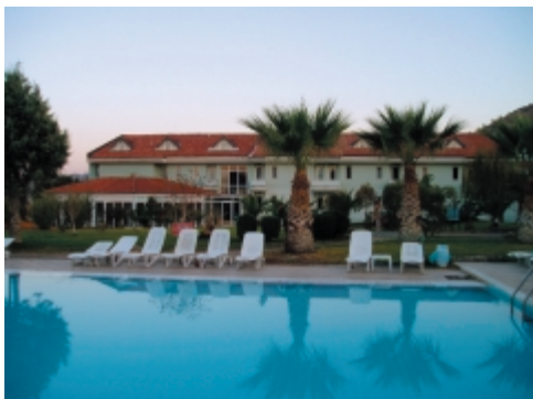
...az ominózus medence