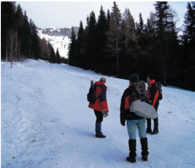
Az un. B terv. Ekkor még minden szépnek látszott

Kb. kilenc óra lehetett, amikor elkezdtek a Rax havas és meredek emelkedőjét – egyelőre normál bakancssal, taposni. Itt nem volt nehéz dolgunk, hiszen a síelők miatt simára volt gyalulva az útvonal. Könnyedén haladtunk egészen a Waxriegel has magasságáig. Majd eleredt az eső. A beöltözést és a hótaposó felvételét követően nekimentünk a Siratófalnak. Az első néhány száz méter megtétele után megértettem, miért kapta a nevét, pedig a java még azután következett. A hegyoldal olyan meredek volt, hogy lépcsőket kellett kialakítanunk a hóban, csak így tudtunk haladni. Az élményt fokozta eleinte az eső, majd