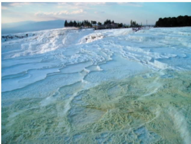
Pamukkalei gipsz teraszok

Hierapoliszt II. Eumenész pergamoni király alapította. A város i.e. 133-ban hódolt be Rómának, a pergamoni királyság többi városával együtt. Az i.sz. 60-ban bekövetkezett nagy földrengés után, i.sz. 196-215 között élte fénykorát. A város hanyatlása i.sz. 6. sz-ban következett be. A romváros nevezetessége az ókori fürdő, melyet ma is előszeretettel használnak a szálloda vendégek. A fürdőmedencékben római kori oszlopok és faragványok találhatóak. Ezen a történelmi levegőjű tájon szinte minden hegycsúcson található egy vár, az egész fennsík történelmi romokkal teli.