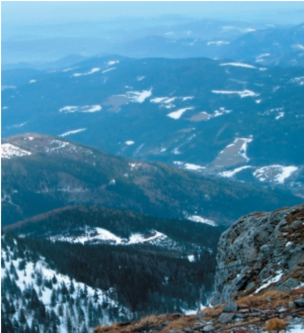
Amikor kitisztult az idő, volt miben gyönyörködni

Sajnos a hótaposó nehéz ter- reviszonyokon teljességgel használatlan. Sík vidéken, dombos utakon jó szol- gálatot tehet, de oldalazni, lép- csőzni, meredek hegyre fel- menni és lejönni ezzel szinte lehetetlen. Kevéske előnyéhez képest a beruházási költsége tetemes. Tömege, térfogata elég nagy ahhoz, hogy minden havas túrára, különösen több- naposra, magunkkal vigyük. Télen – hóviszonyoktól függő- en, céljainkra a legmegfele- lőbbnek a túrási látszik. Hiszen amíg mi lépésről-lépésre kí- n-lódva haladtunk előre, addig a sielők gyorsan elhagytak min- ket. A lesiklás előnyéről, élmé- nyéről pedig nem kell említést tennem, az egyértelmű.