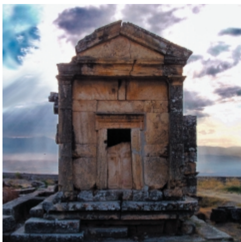
Kora keresztény sír Hierapoliszban

Máriáról. János Máriát magával hozta i.sz. 37-ben, aki élete utolsó napjait itt töltötte. Szűz Mária háza megtalálható Ephesostól 8 km-re, Meryemanában.