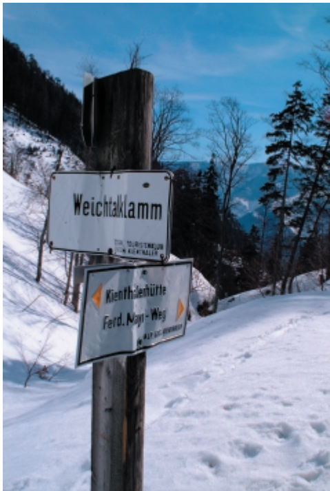
A pénteki túránk „csúcsa”