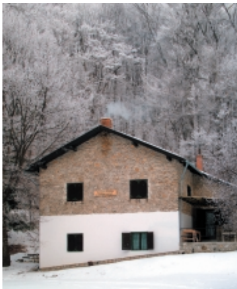
Tamás kúti vendégház kívülről