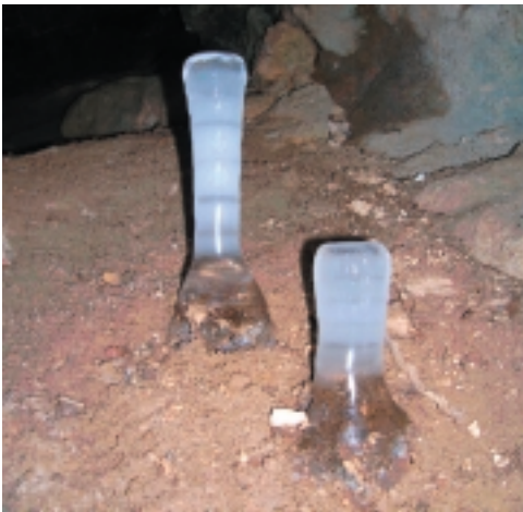
Jégcsapok az Imó-kő barlangban

A völgyben folytattuk utunkat kék kereszt jelzésig. Itt jobbra fordultunk a Hereg rét felé. Itt sokan szánkóztak a kis domboldalon. Hamarosan az országútra tértünk, ahol a hegység gyűrődéseit tanulmányoztuk.