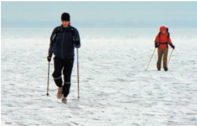
„Az órák futottak, a vándorok gyalogoltak, a fonyódi dombok cammogtak“

Siófokot elhagyva Andris hátraszólt: – inentől minden lépés ajándék. – Valóban ajándék volt. Az erős szél hatására, kitisztult az ég, bár a Hold még bújócskát játszott a felhők között, a part menti települések összeértek fényekkel, aranykoszorút alkotak. E fényáradatban szinte diadalmenet volt Balatonligának tartani. Siófok fényei, most elfelejtették a sziréneket partra küldeni. A vendégmarasztaló, csábító énekek elmaradtak.