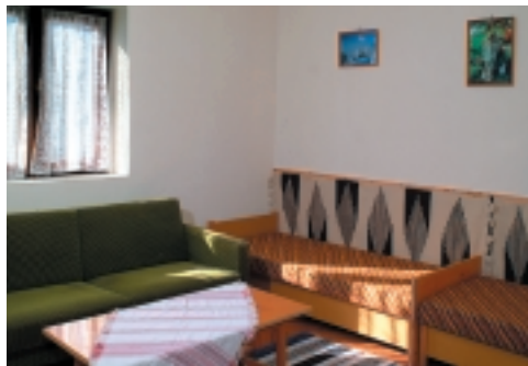
Tamás kúti vendégházban az egyik felső szoba

Vasárnap csak egy kis átmozgató sétára mentünk. A kék jelzésen, ahonnan tegnap érkeztünk, indultunk el a Lök völgyig. Itt egyenesen folytattuk, a kék kör jelzésen az Imó- kőig. Itt nagyon sok kis barlang van. Az Imó kővel szemben, felmáztunk az egyik barlanghoz, ahol érdekes látványban volt részünk. A barlangban kis cseppkőes képződmények voltak.